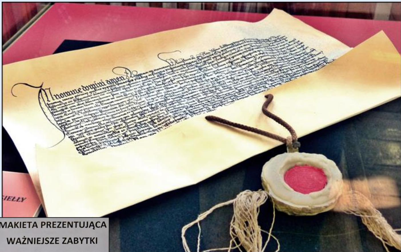
MAKIETA PREZENTUJĄCA WAŻNIEJSZE ZABYTKI PIOTRKOWA I OKOLIC XIV-XX WIEK