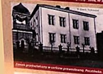
Zamek przekształcony w serwis pocztowy. Pocztówka.