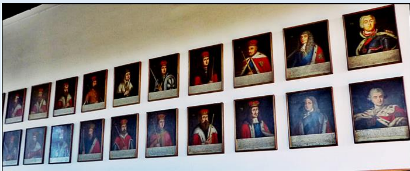
por.: Częstochowa, Jasna Góra - Sala Rycerska w której znajduje się Spis królów Polski, sięgając na okres przed Mieszkiem I