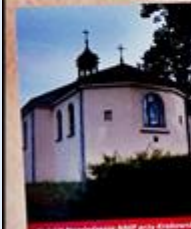
Kościół św. Ducha - kościół fary angielskiej - rekonstrukcja i wiatki szkieletowe

W roku 1313 Piotrków był wspomniany jako ośrodek miejski. Świadczy o tym użycie określenia: in nostra civitate Petricouensis , które pojawiło się w dokumencie Władysława Łokietka zwalniającym poddanych opactwa sulejowskiego od cła i zezwalającym na handel solą, mięsem i suknem w Piotrkowie. Miasto w XIV wieku przejęło funkcje administracyjne i sądowe leżących w pobliżu kasztelanii - rozpięskiej oraz wolskiej. Do dalszego rozwoju Piotrkowa przyczynił się Kazimierz Wielki, któremu miasto zawdzięcza powstanie murów obronnych.