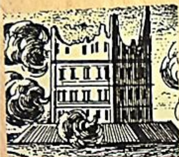
Zamek - widok z drugiej połowy XV. Fragment szkicu z rysunku Dahlberga z roku 1857, wg dzieła S. Pułendoja, De rebus a Carolo Gustavo Sueciae regia gestis, 1697.