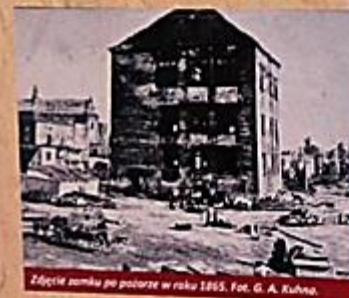
Zdjęcie zamku po pożarze w roku 1865.