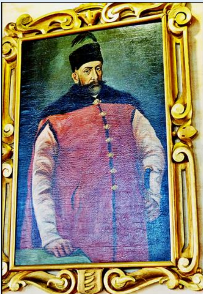
KRÓL STEFAN BATORY, AUTOR NIEZNANY, XIX-WIECZNA KOPIA OBRAZU MARCINA KOBERA Z 1594 ROKU.