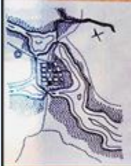
Plan rekonstrukcji układu przestrzennego Piotrkowa z pocz. XIV w. (zgodn. wg K. Głowackiego) - uwzględniono domniemany plan oraz ślady komunikacyjne w najbliższej okolicy miasta.