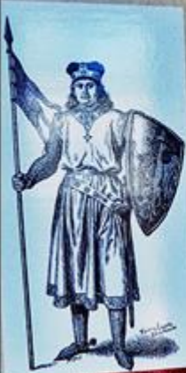
Leszek Czarny - grafia Waltera S. Redibowatego (iluminacja publikacji)

XIII wiek w Polsce to czas rozbięcia dzielnicowego. Księstwa konsolidowały się wewnętrznie rozbudowując własną administrację i gospodarkę, co powodowało powstawanie większej liczby różnego rodzaju dokumentów dotyczących już nie tylko spraw najwyższej wsi państwowej, ale także drobnych spraw życia codziennego. Pojawiają się również pierwsze dokumenty związane z Piotrkowem - najstarsze z nich (1217 rok i 1222 rok) dotyczą sporów opata klasztoru cystersów w Sulejowie z poddanymi chłopami, kolejne (1233 rok, 1241 rok, 1262 rok) dotyczą zjazdów rycerstwa dzielnicowego.