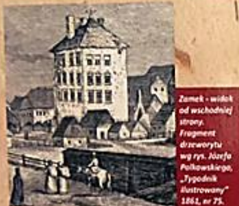
Zamek - widok od wschodniej strony. Fragment drzeworytu wg rys. Nisefa Polkowskiego, „Tygodnik Ilustrowany” 1861, nr 75.