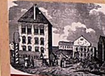
Rycina zamku zamieszczona w czasopiśmie „Kłosy” 1868, nr 171.