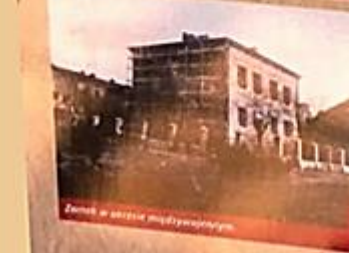
Zamek w okresie międzywojennym.

Zamek królewski, przez znawców i badaczy często określany mianem pałacu wieżowego, lub też wieży mieszkalnej powstał w latach 1511-1519 na zlecenie Zygmunta Starego. Budowę siedziby królewskiej powierzono muratorowi władcy - Benedyktowi Sandomierzaninowi.