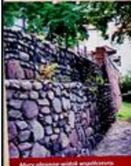
Mury obronne wsiół angielskich