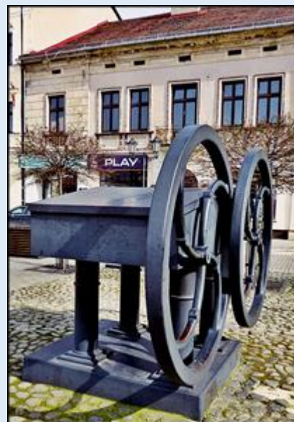
w tle: Kościół pw. Wniebowzięcia NMP