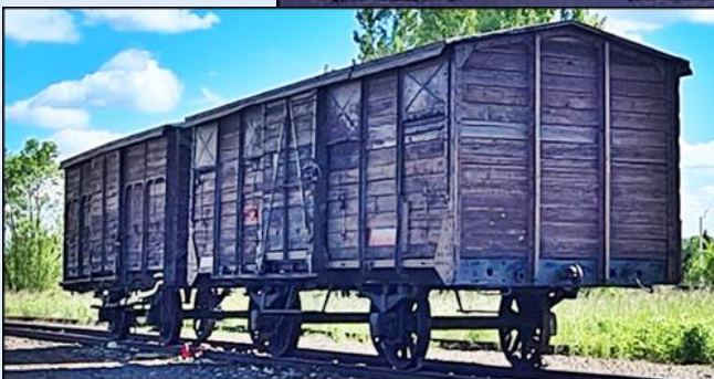
Rytmami pięcunastego kwietnia, kilby został wyłomony postawienie w głowie, umieszczony w baraku i przetrzy w Jaskółce i barakach w Birkenau. Odniesienie go w 1947 roku.