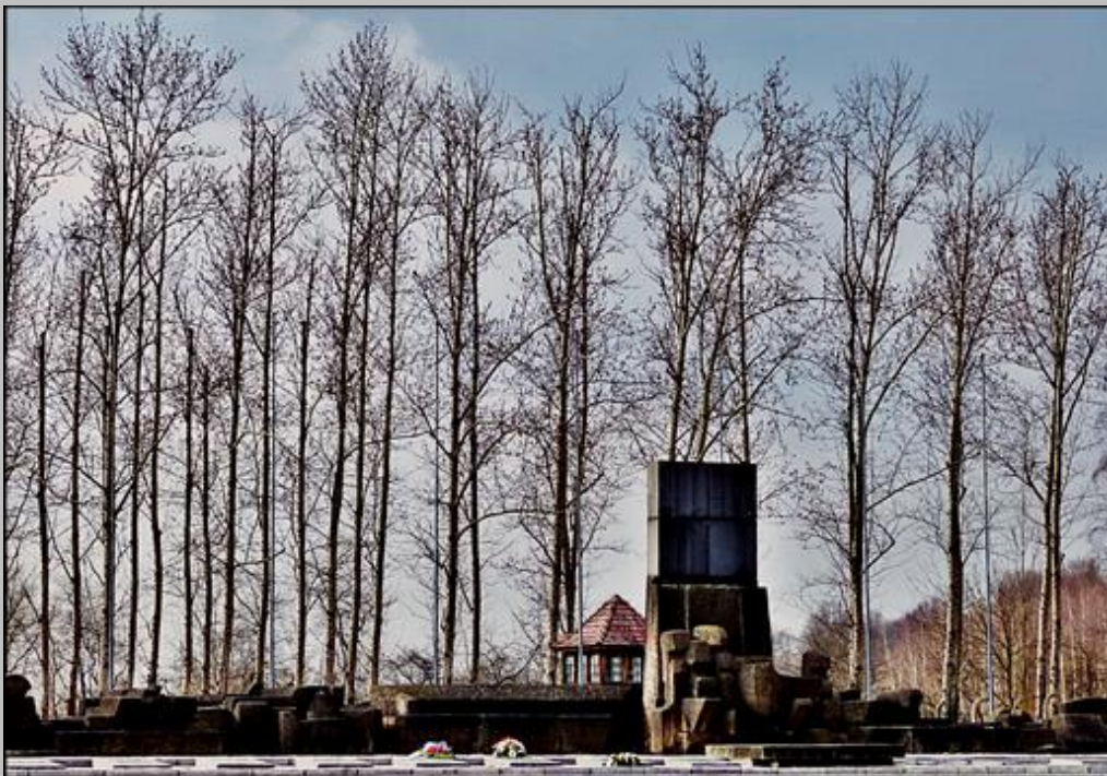
Brzezinka-Birkenau - Międzynarodowy Pomnik Ofiar Obozu