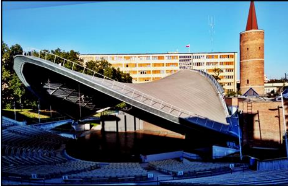
Amfiteatr Tysiąclecia - Wieża Piastowska