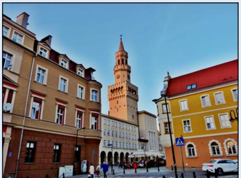
Rynek i Ratusz Miasta