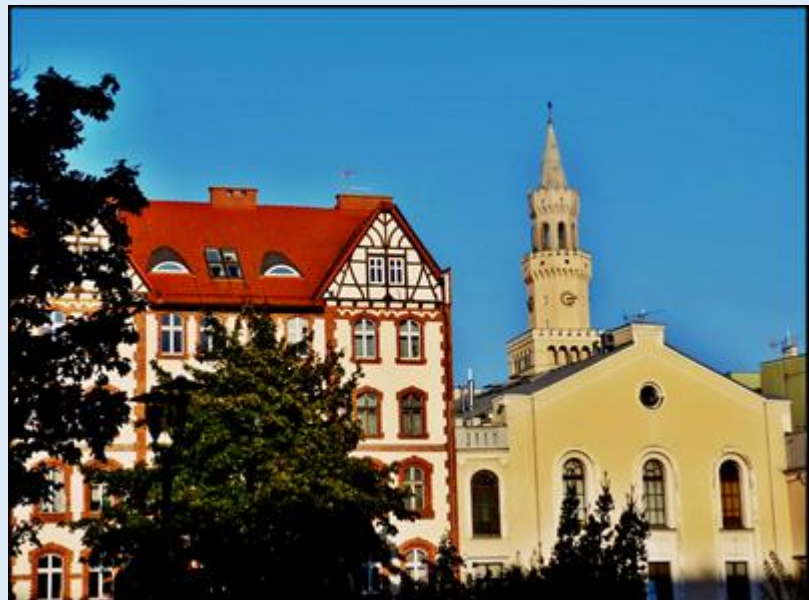
zob. kościół Opola