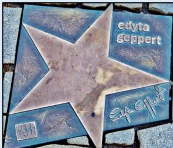
Aleja Gwiazd Festiwalu Polskiej Piosenki k. Ratusza