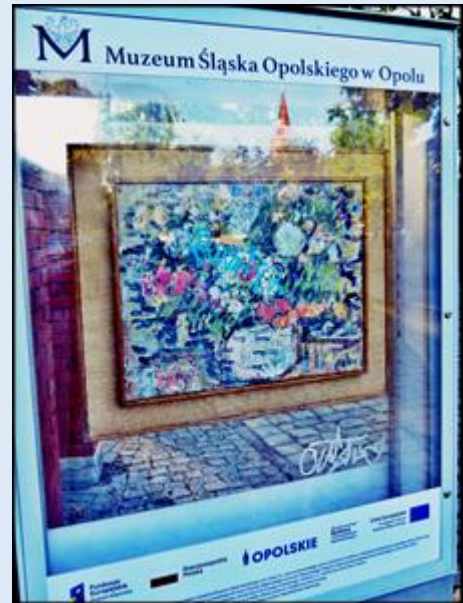
Muzeum Polskiej Piosenki - Muzeum Śląska Opolskiego