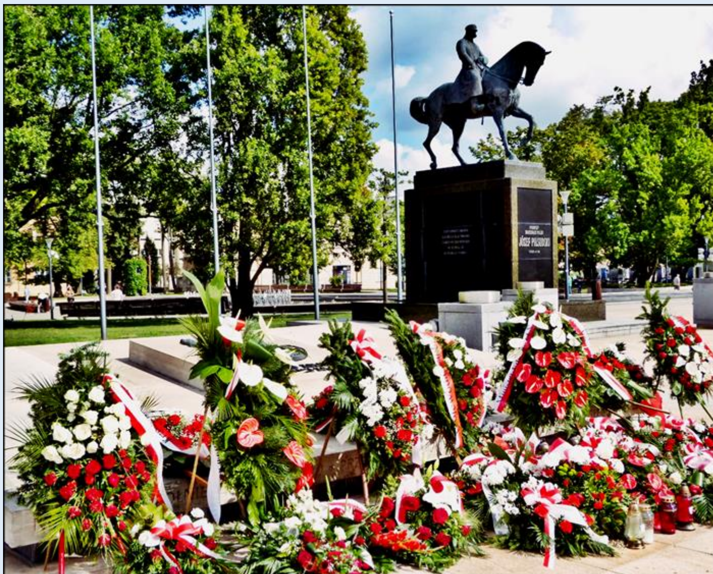
obok: Pomnik Nieznanemu Żołnierzowi