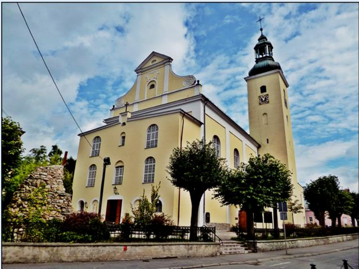
zob. Kościoły i Kaplice w Łądku Zdroju