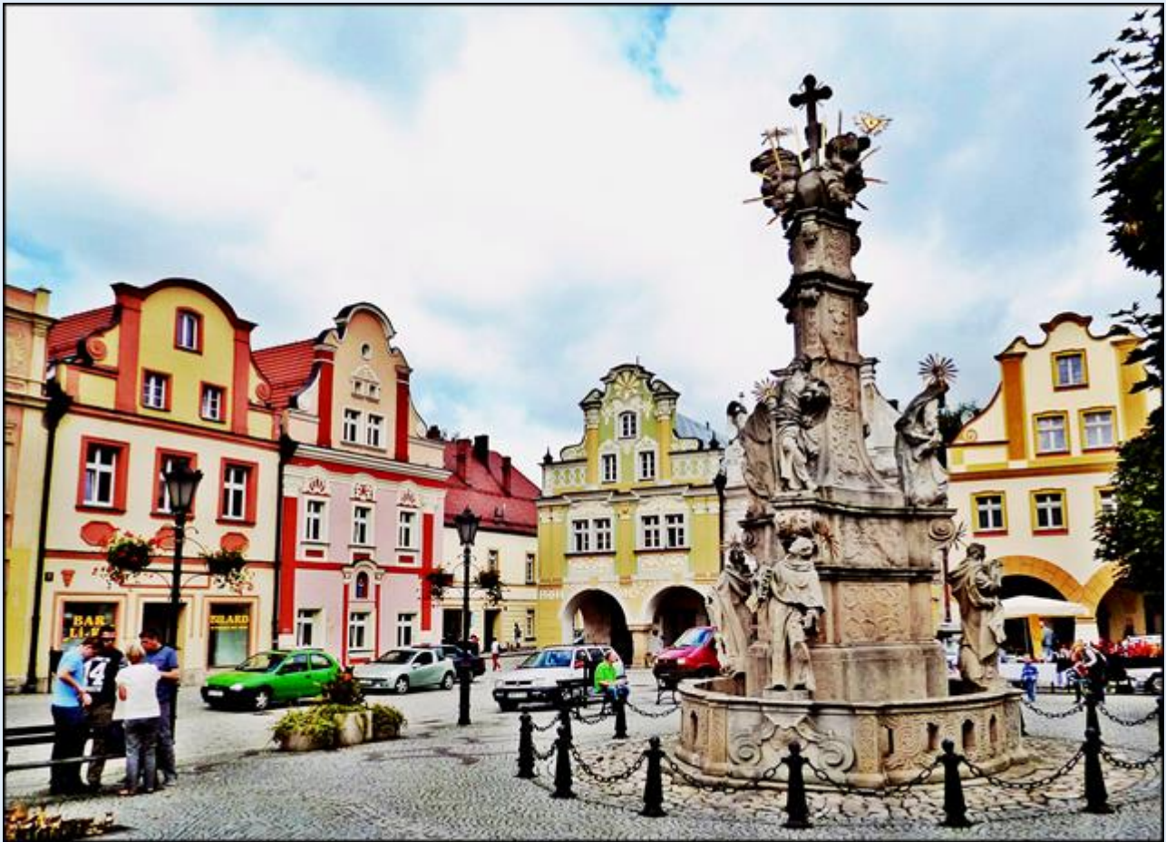
zob.: Pomnik Trójcy Przenajświętszej