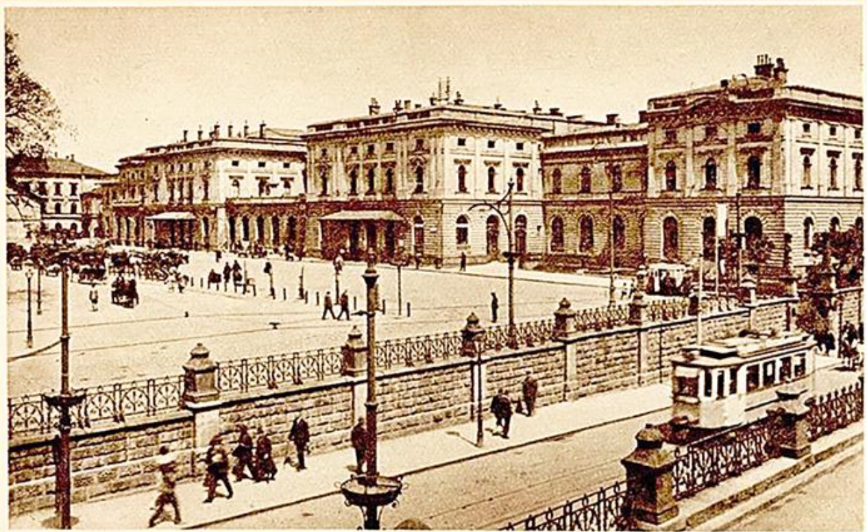
KRAKAU Hauptbahnhof u. Bahnhofstrasse