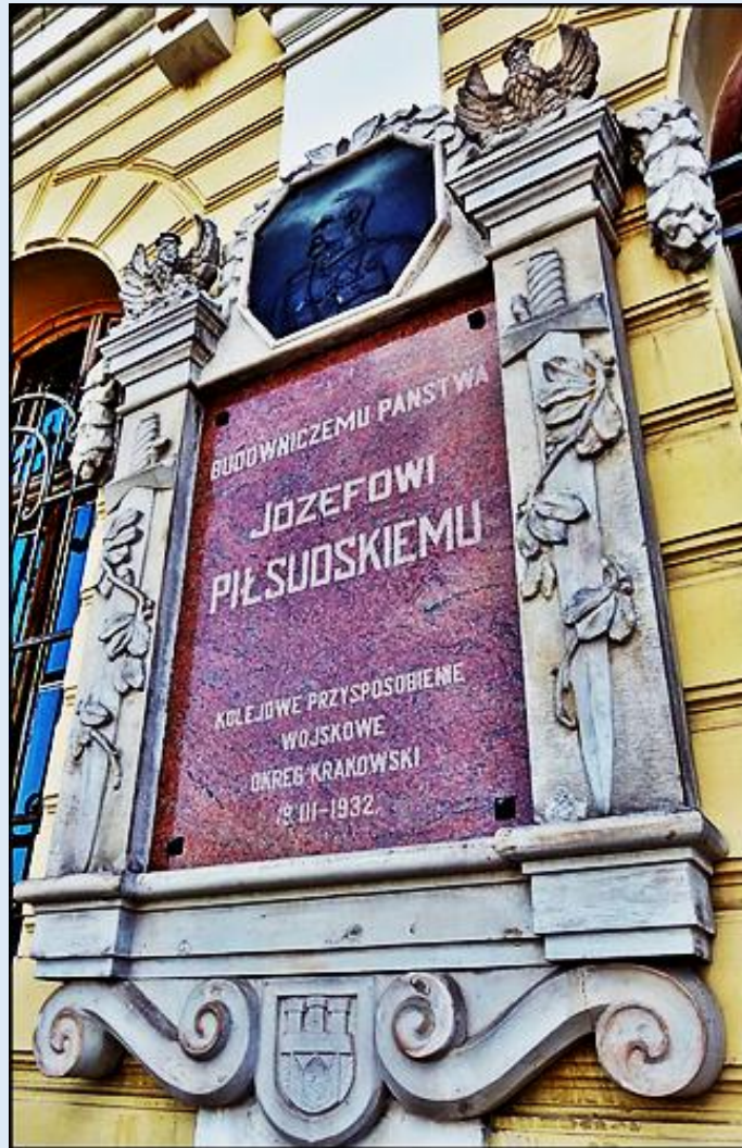
od 11 maja 2021 r. Patronem dworca jest Józef Piłsudski