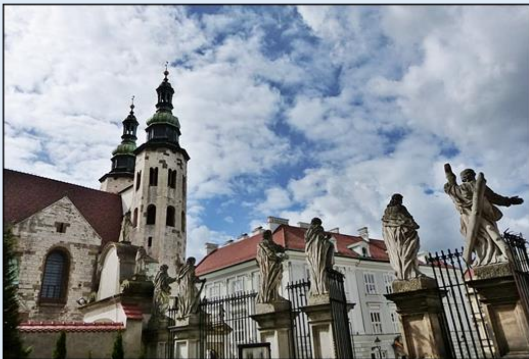
na pierwszym planie figury 12 Apostołów przed Ko. Piotra i Pawła , w tle: Ko. św. Andrzeja Apostoła