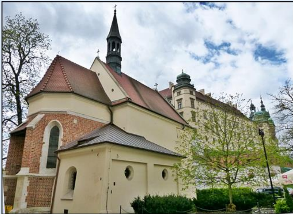
Ko. św. Idziego – w głębi: Wawel