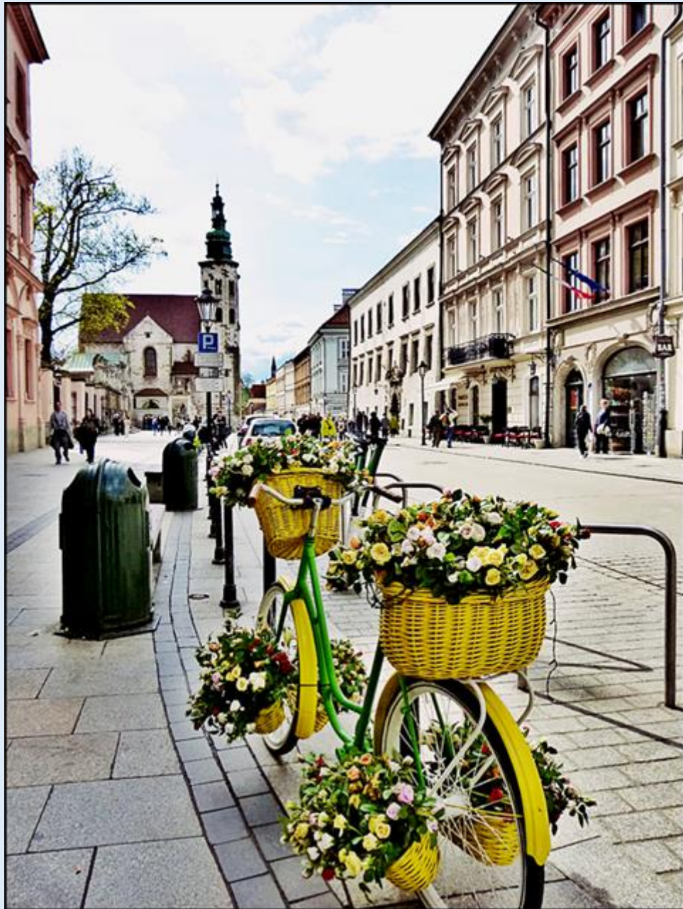
widok na Kościół św. Andrzeja