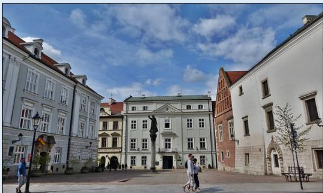
widok na Plac św. Marii Magdaleny z pomnikiem Piotra Skargi