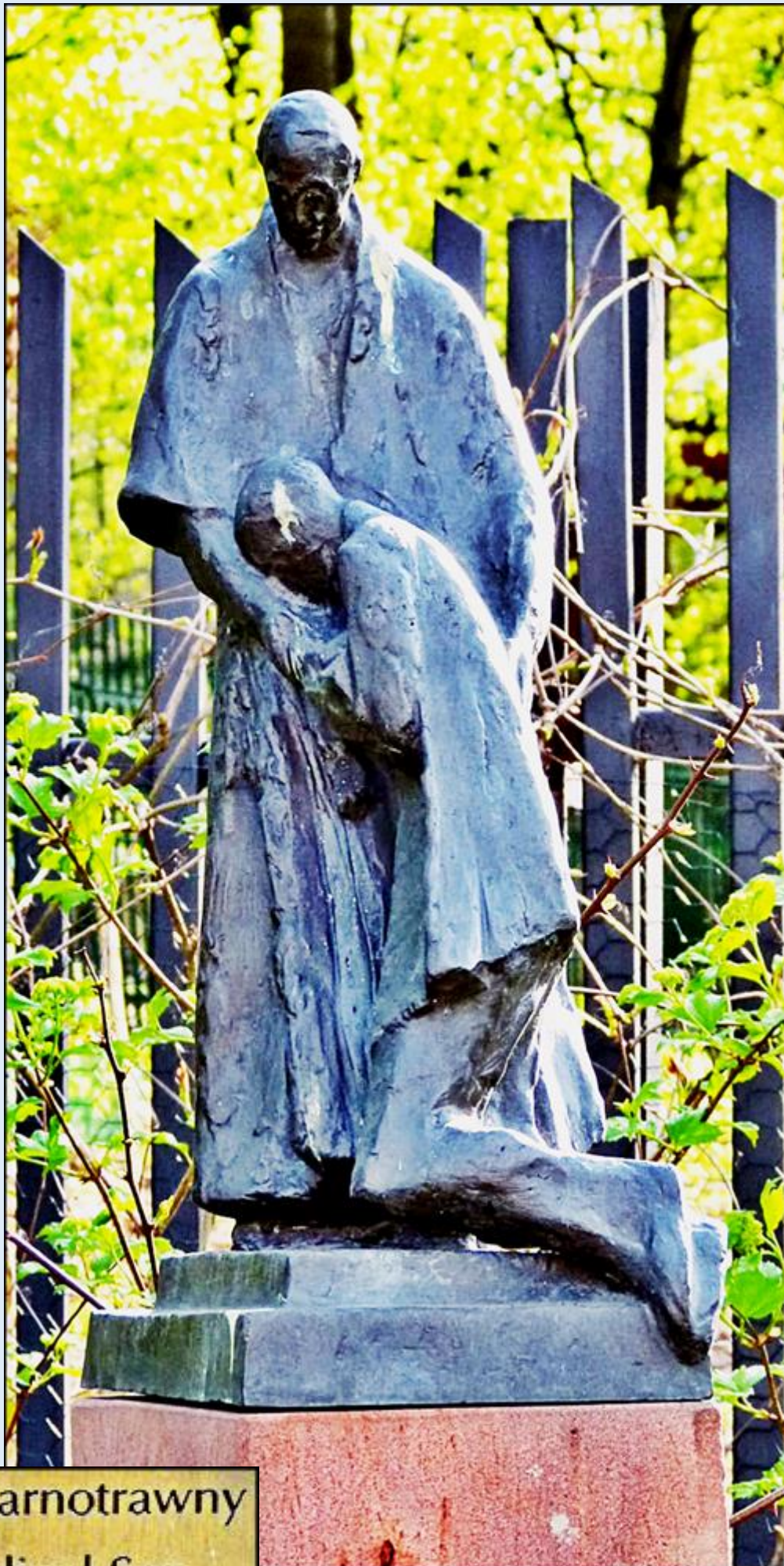
Syn Marnotrawny Prodigal Son