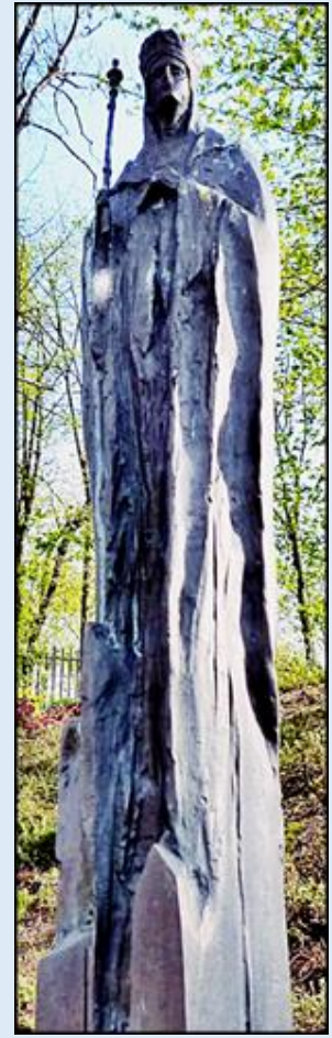
św. Faustyna – O. Augustyn Kordecki – św. Stanisław – św. Jadwiga Królowa