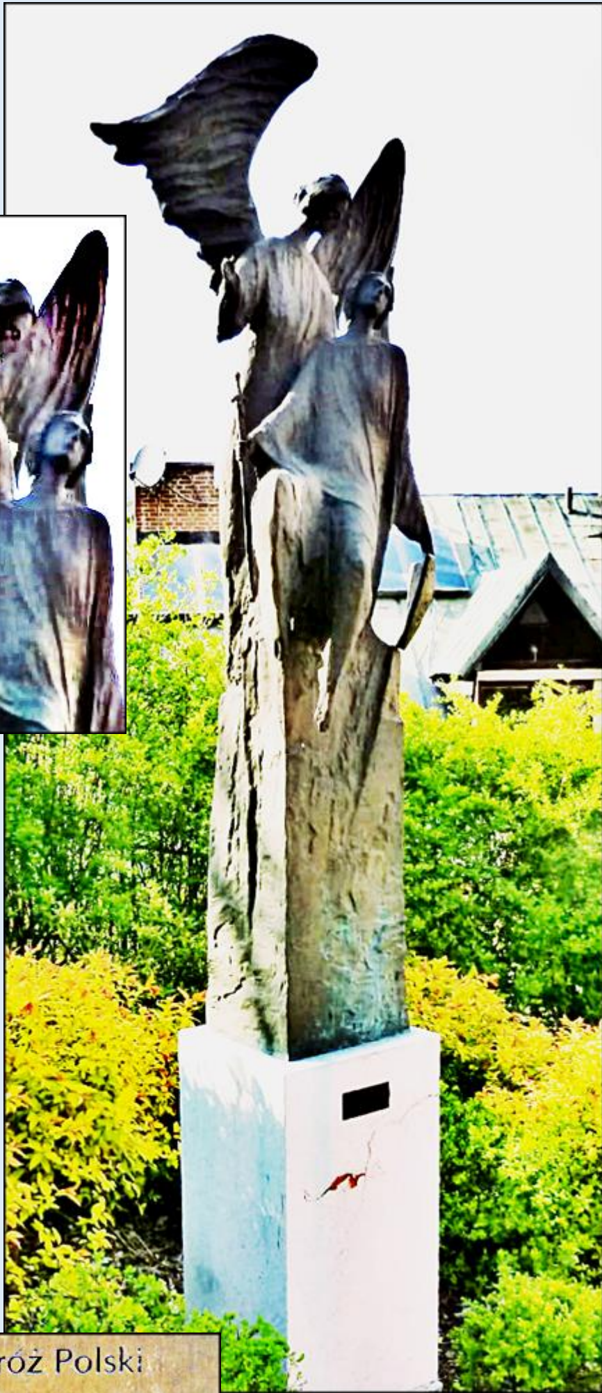
Aniol Stróż Polski Guardian Angel of Poland