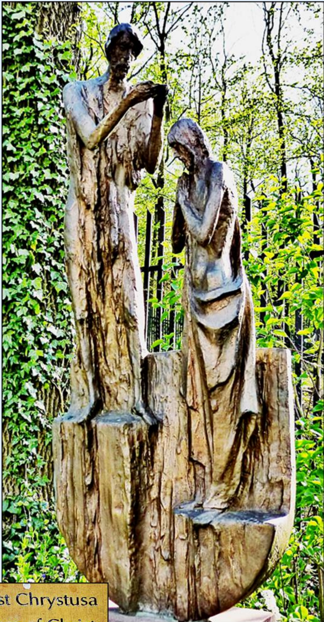
Chrztst Chrystusa Baptism of Christ