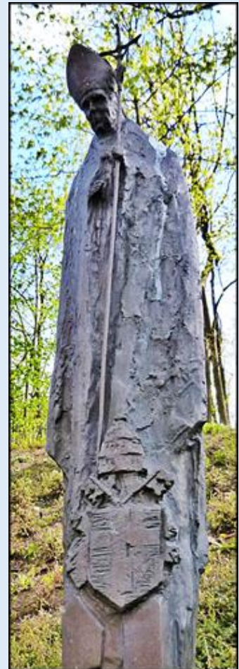
św. Jan Kanty – św. Wojciech – św. Jan Paweł II zob. Ołtarz Trzeciego Tysiąclecia przy Bazylice „Na Skałce”