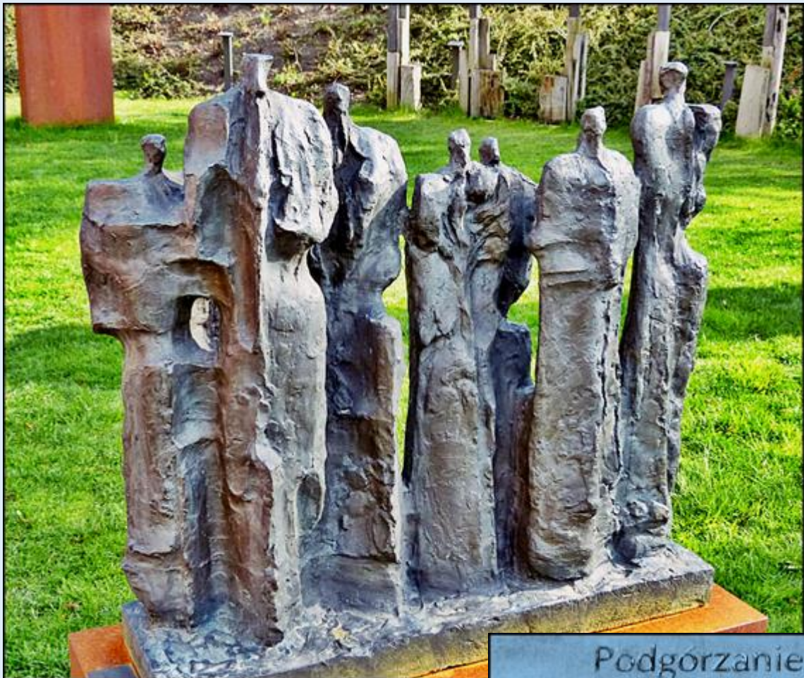
Podgórzanie The People of Podgórze