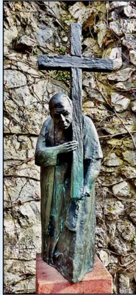
Zwiastowanie NMP – św. Jan Paweł II