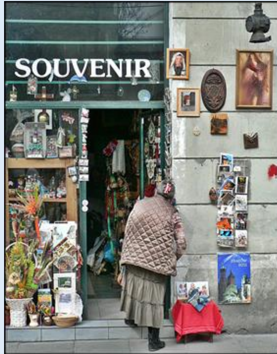
zob. Sakralia w Muzeum Etnograficznym na Placu Wolnica 1