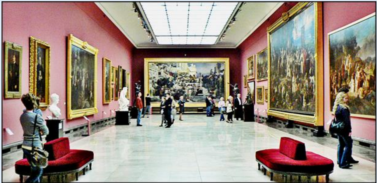
zob. Muzeum Narodowe w Sukiennicach