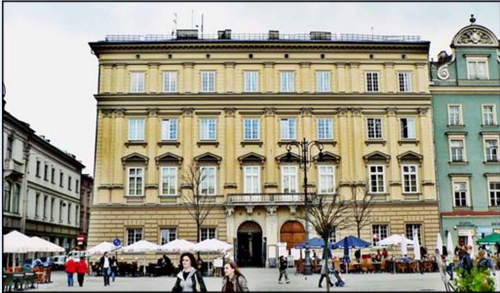
Pałac pod Baranami