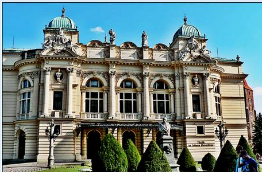
Teatr im. Juliusza Słowackiego