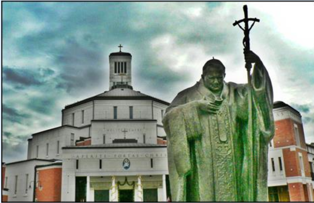
zob. Kościoły Krakowa