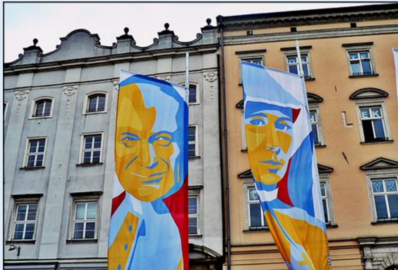
zob. Muzeum Jana Pawła II przy Sankt. Jana Pawła II