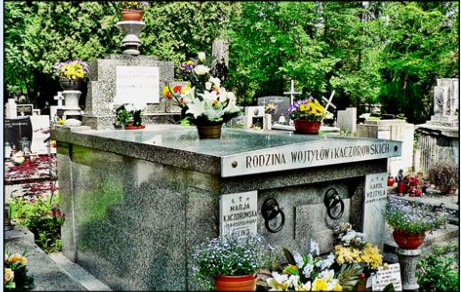
zob. Cmentarz Rakowicki