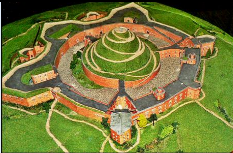
zob. Muzeum w Fortach Kopca Kościuszki