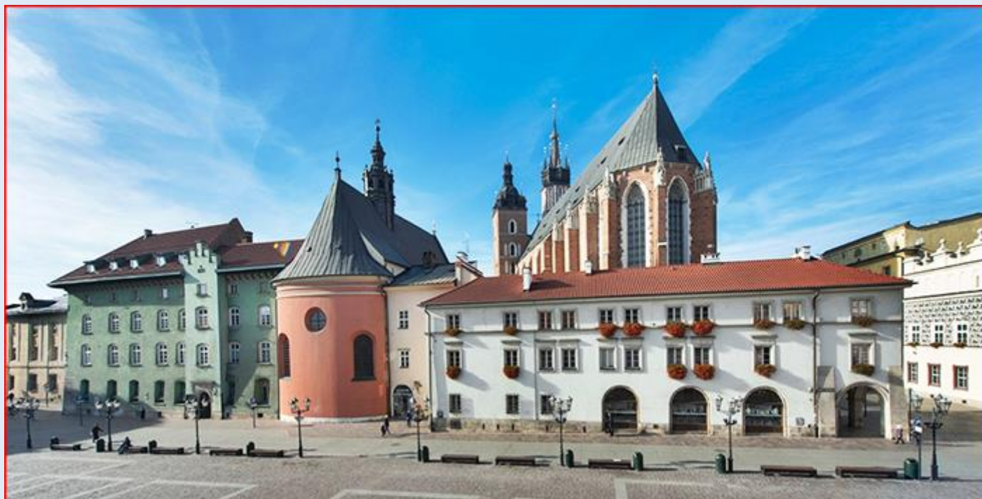
na tyłach Kościoła św. Barbary i Bazyliki Mariackiej