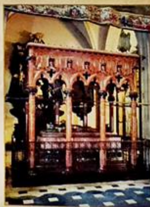
Pomnik króla Władysława Warneńczyka