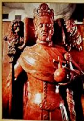
Nagrobek króla Władysława Jagiełły

Katedra Wawelska to miejsce pochówku polskich monarchów. Początkowo królów chowano w komorach grobowych znajdujących się pod posadzką. Pierwszym, który spoczął na Wawelu był Władysław Łokietek. Począwszy od Kazimierza Jagiellończyka ustalili się zwyczaj grzebania władców w osobnych kaplicach dobudowanych do Katedry. Tak powstała Kaplica Świętokrzyska bogato zdobiona dekoracją malarską przez malarzy ruskich, ze wspaniałym nagrobkiem wyrzeźbionym przez Wita Stwosza, uznawanym za arcydzieło sztuki późnogotyckiej. Wśród licznych kaplic Katedry Wawelskiej na szczególną uwagę zasługuje również kaplica ufundowana przez Zygmunta I Starego zwana Zygmuntofską. Zaprojektowana przez włoskiego mistrza Bartolomeo Berrecci i wykonana w latach 1519-1533 przez rzeźbiarzy włoskich stanowi perłę renesansu Europy Środkowej. Jednak sam Król Zygmunt I Stary i jego następcy wraz z członkami królewskich rodzin są pochowani w podziemnych kryptach katedralnych. Większość znajdujących się tam trumien i sarkofagów królewskich to prawdziwe arcydzieła sztuki odlewniczej takie jak sarkofagi Zygmunta Augusta, Stefana Batorego i Zygmunta III oraz złożone miedziane trumny Władysława IV oraz jego żony Cecylii Renaty.