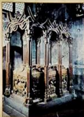
Nagrobek króla Kazimierza Jagiellończyka