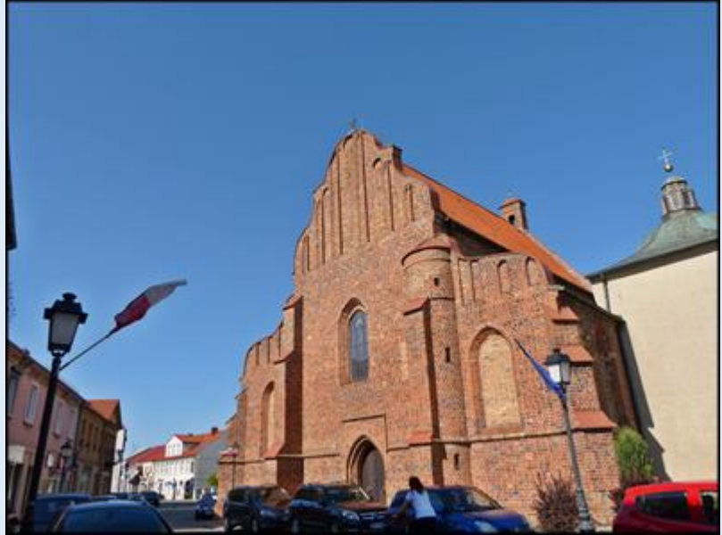
Kościół pw. św. Bartłomieja