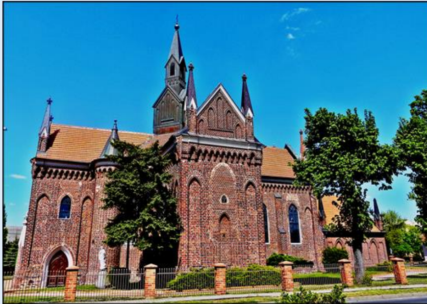
Kościół pw. św. Andrzeja