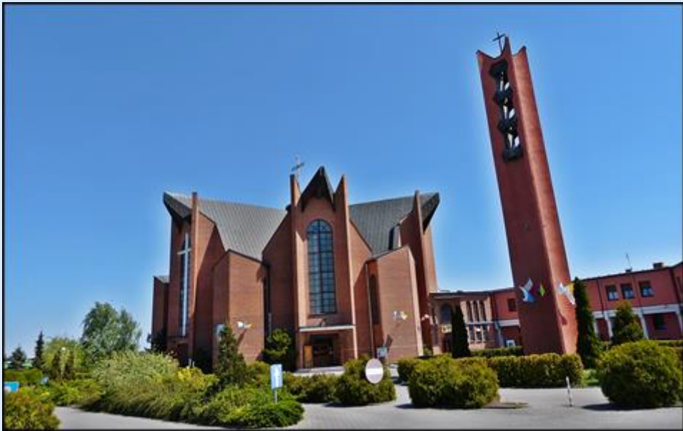
Kościół pw. NMP Królowej Polski