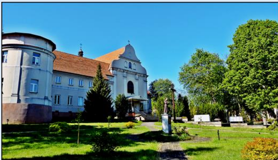
Kościół pw. św. Marii Magdaleny (OO. Reformaci)