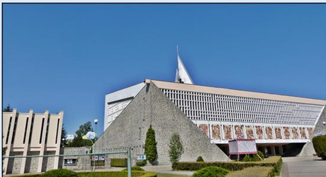
Kościół pw. św. Maksymiliana Kolbe