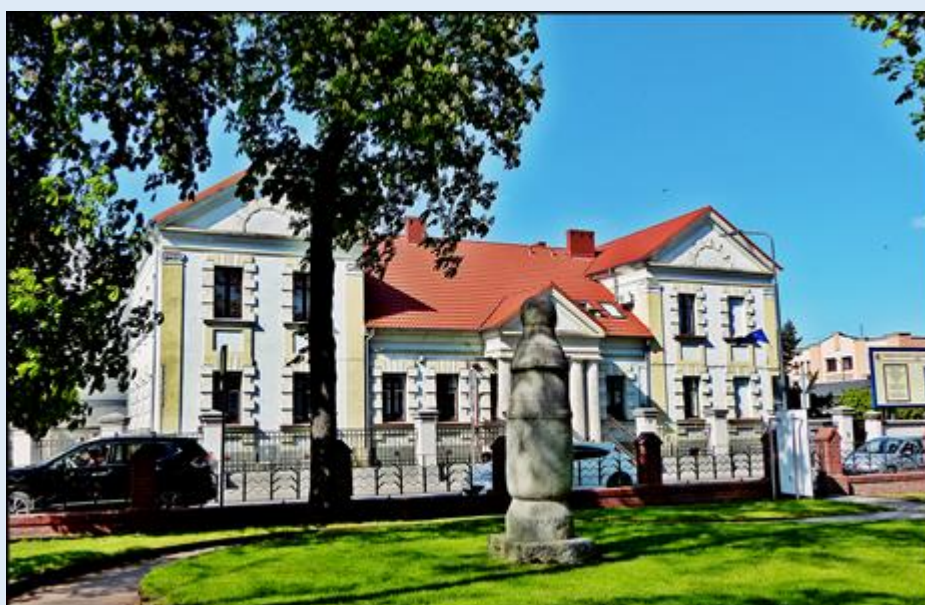
Słup drogowy z 1151 r.