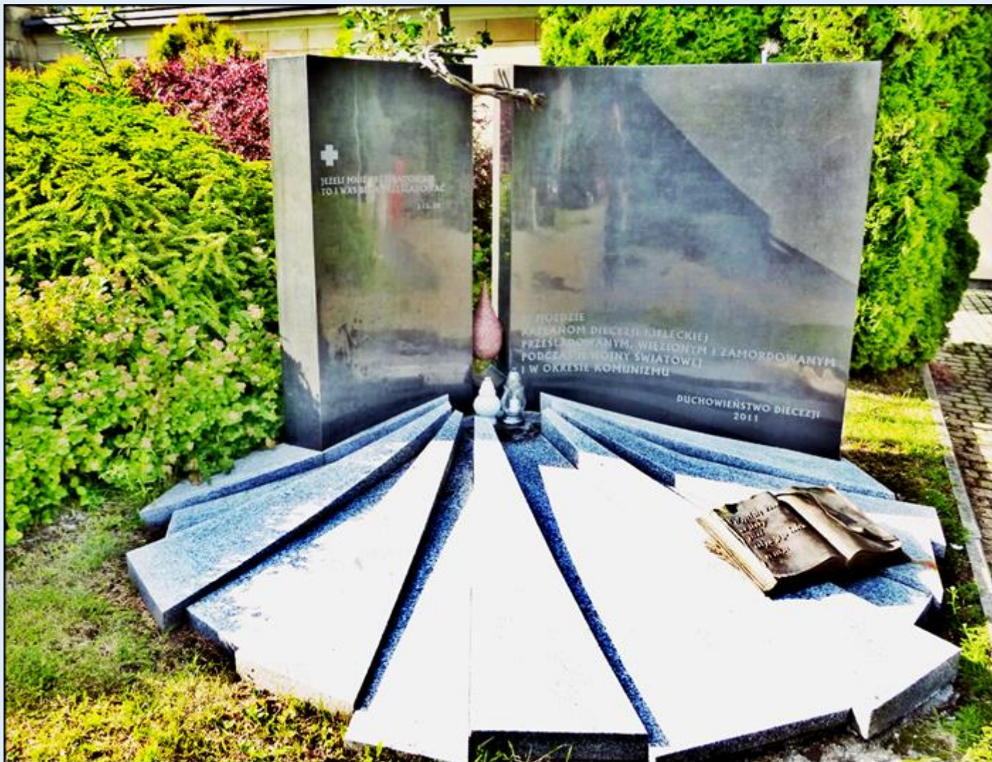
Pomnik 'W Hołdzie Kapłanom Diecezji Kieleckiej'