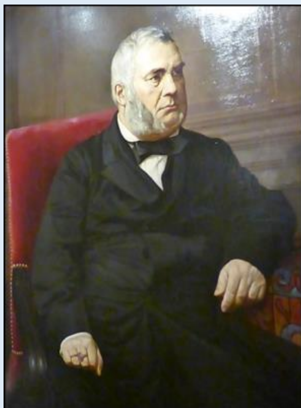
Józef Pankiewicz 1866—1940

Portret dziewczynki w czerwonej sukience