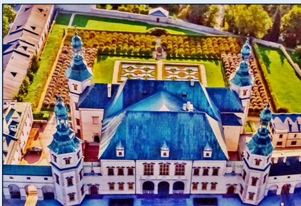
Muzeum Narodowe (dawniej: Pałac Biskupów Krakowskich) z lotu ptaka (zdj. z banera Muzeum) zdjęcia: Jan Nitecki