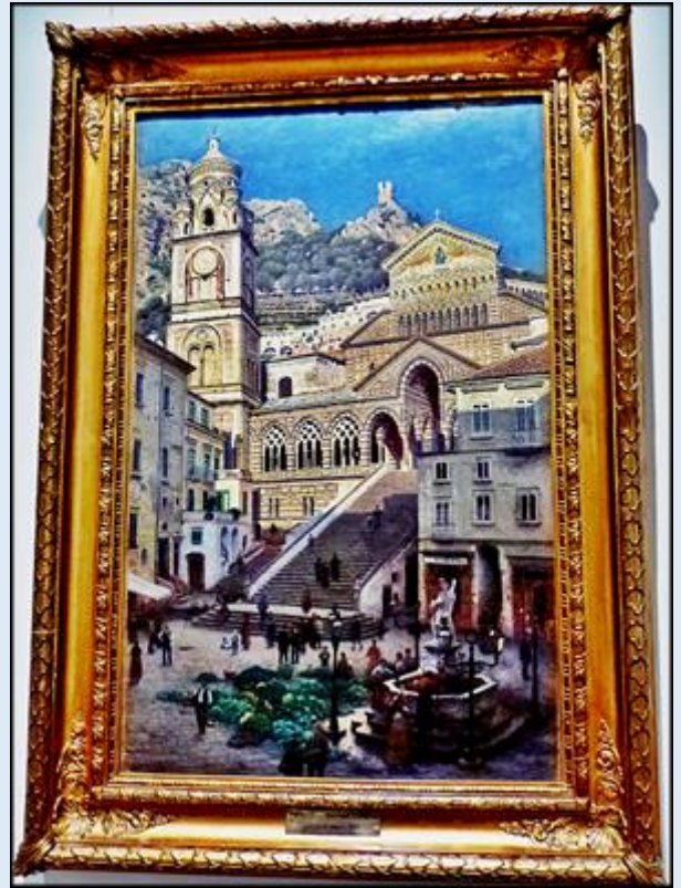
Aleksander Gieryski 1850—1901 Katedra w Amalfi