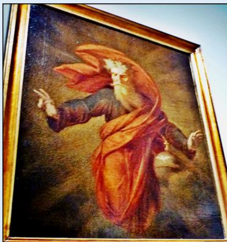
Rafał Hadziewicz 1803—1886 Bóg Ojciec 1869 | olej, płótno