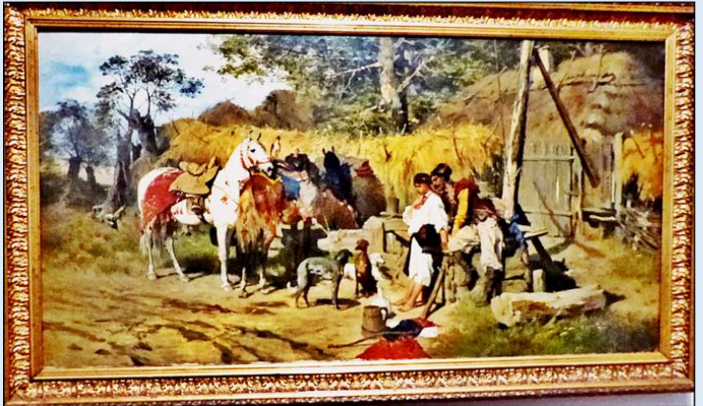
Józef Brandt 1841—1915 Zaloty. Kozak z dziewczyną przy studni