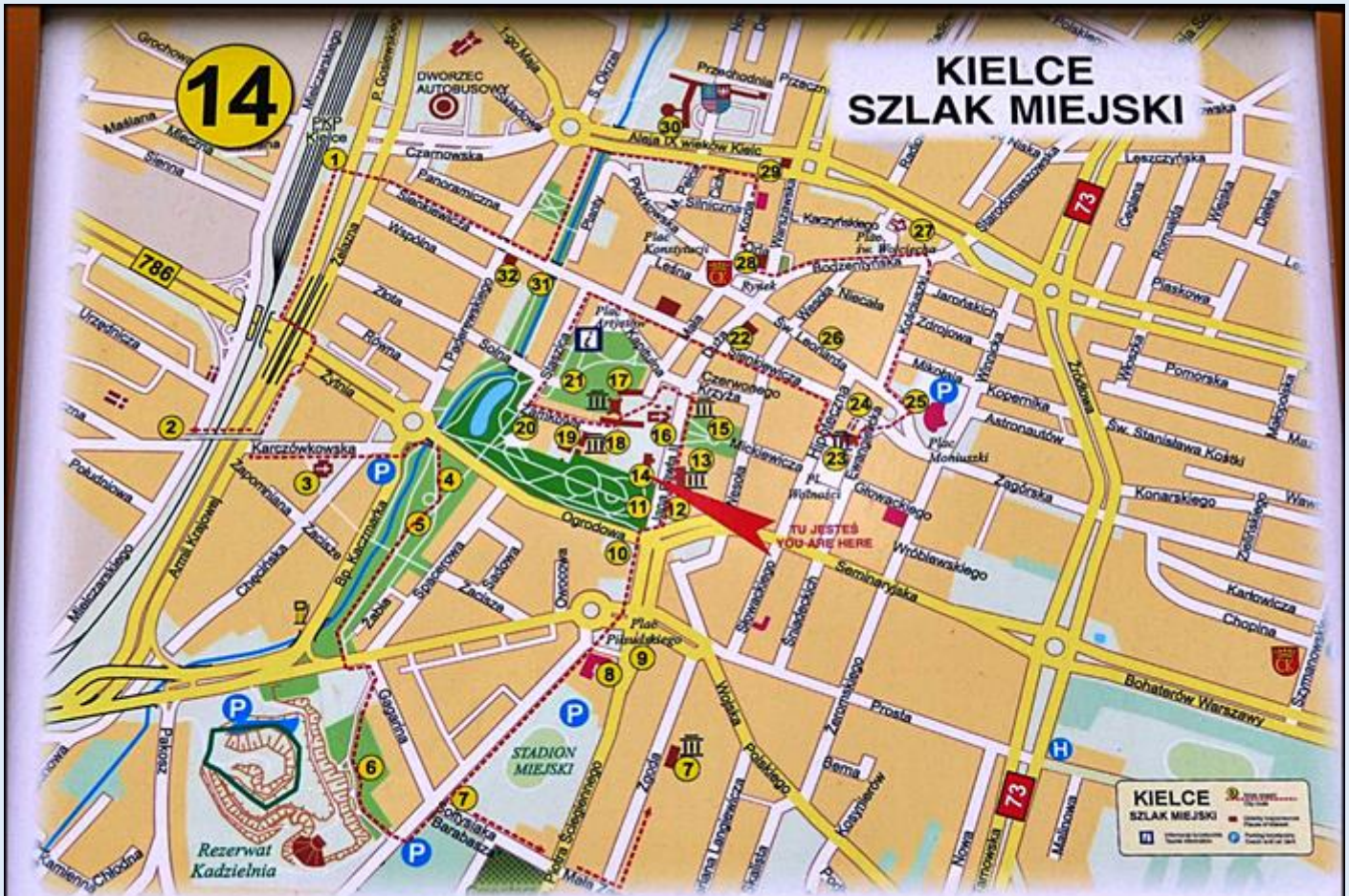
14. Dworek Laszczyków – Muzeum Wsi Kieleckiej