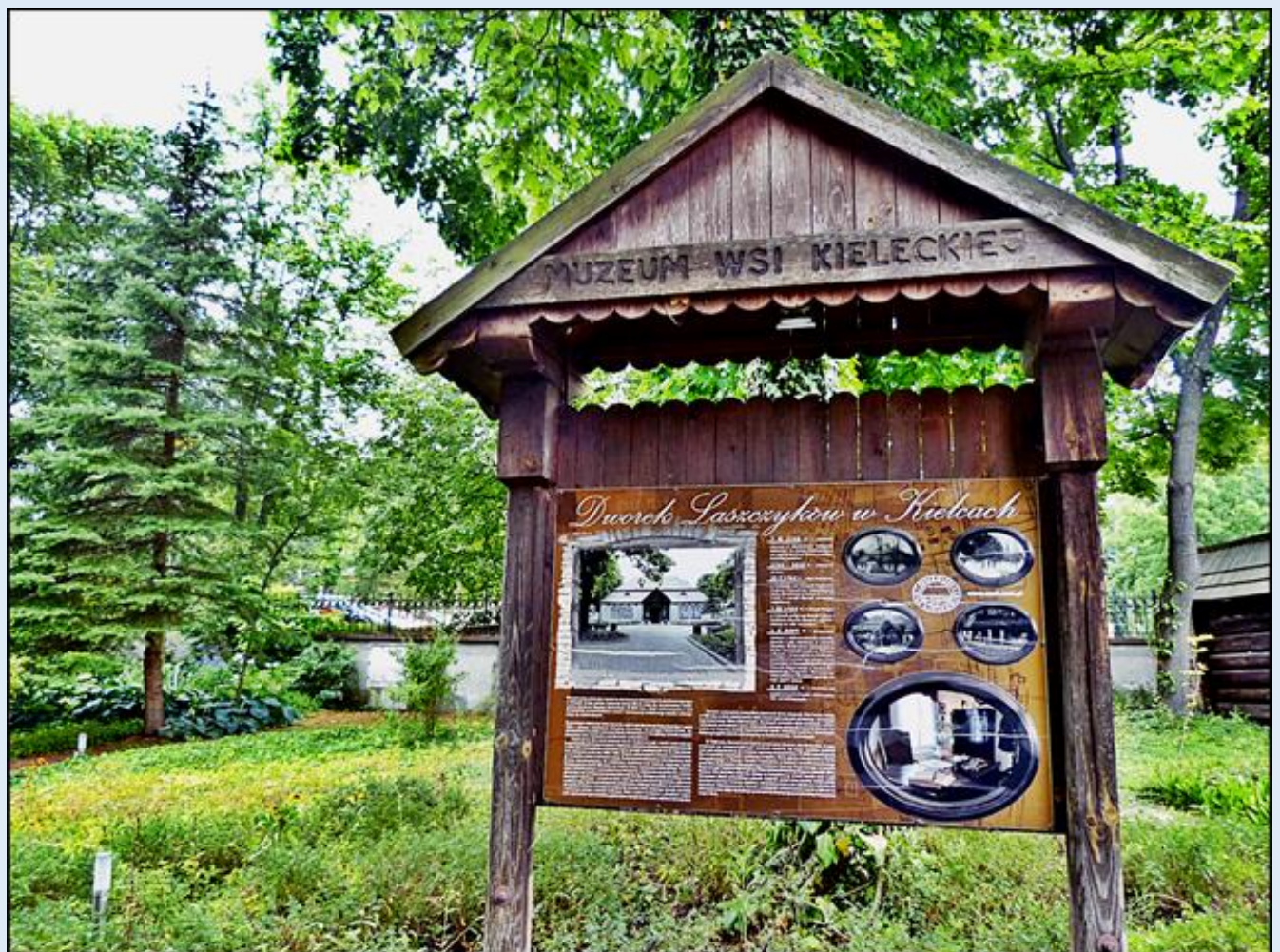
14. The Laszczyk Family's Manor: