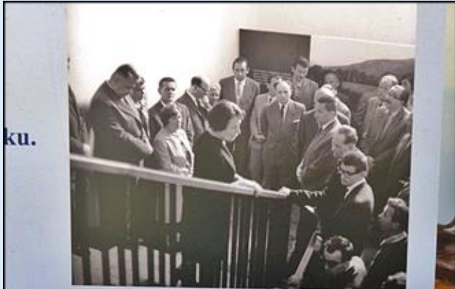
Otwarcie Muzeum Lat Szkolnych Stefana Żeromskiego