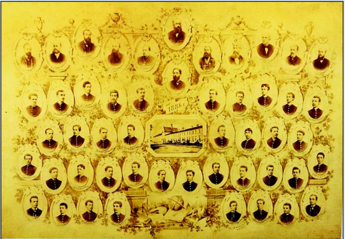
Tableau maturalne z 1886 roku (Stefan Żeromski w drugi od lewej w drugim rzędzie od góry)