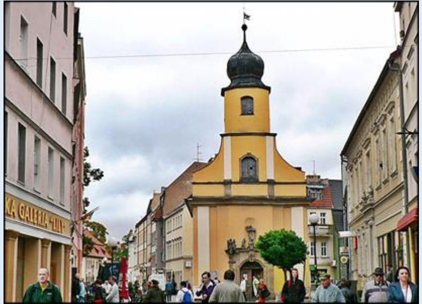
zob. Kościoły Jeleniej Góry