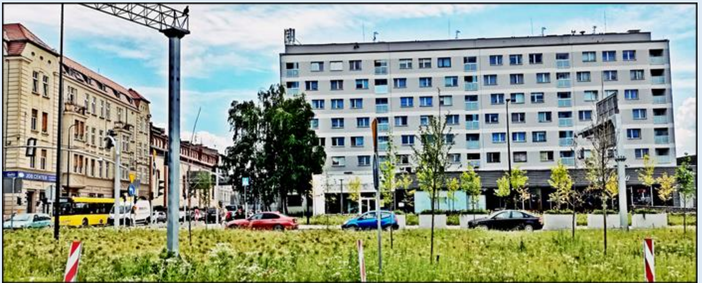
w tym miejscu stał posąg Germania-Denkmal