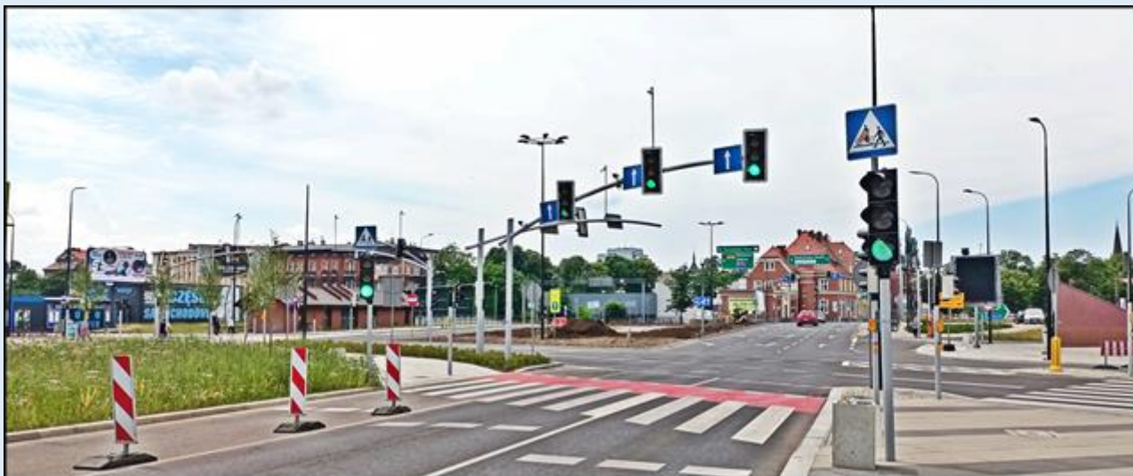
ul. Dworcowa z pozycji pomnika; w głębi na prawo wieża Kościoła pw. św. Barbary