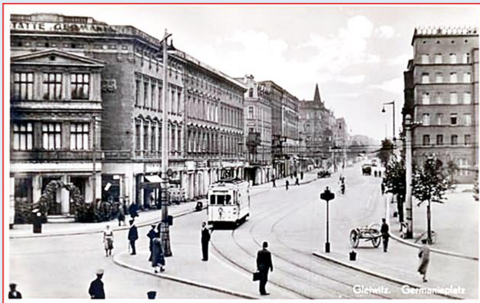
zdjęcie historyczne z tej samej pozycji