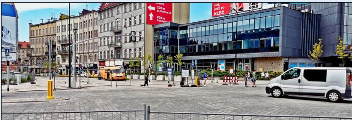
widok od strony dworca na ul. Zwycięstwa