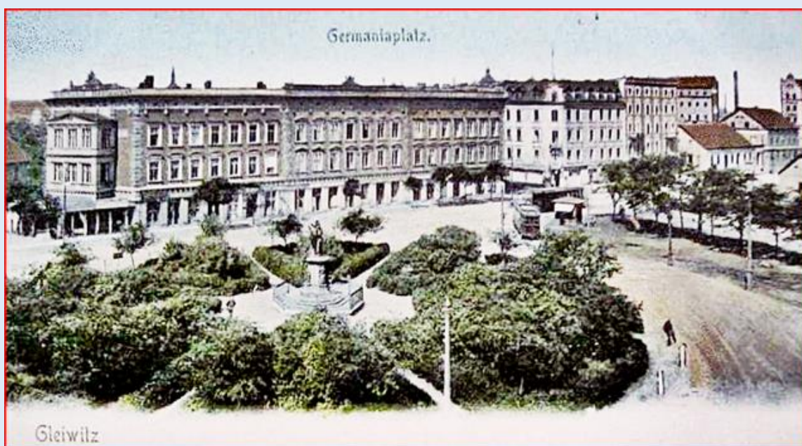
widok z miejsca pomnika w kierunku obecnej ul. Bohaterów Getta Warszawskiego