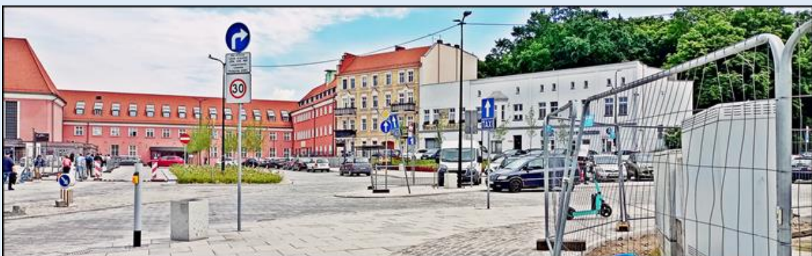
zjazd z ul. Bohaterów Getta Warszawskiego w kierunku dworca