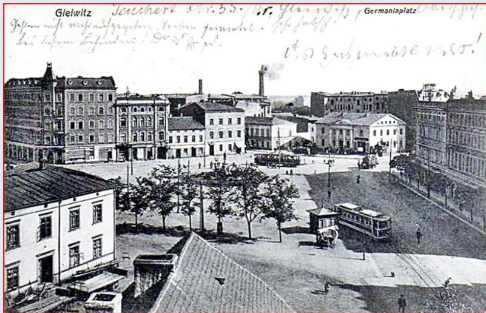
Miejsce, gdzie stał pomnik Germania Germania-Denkmal w latach 1874-1928