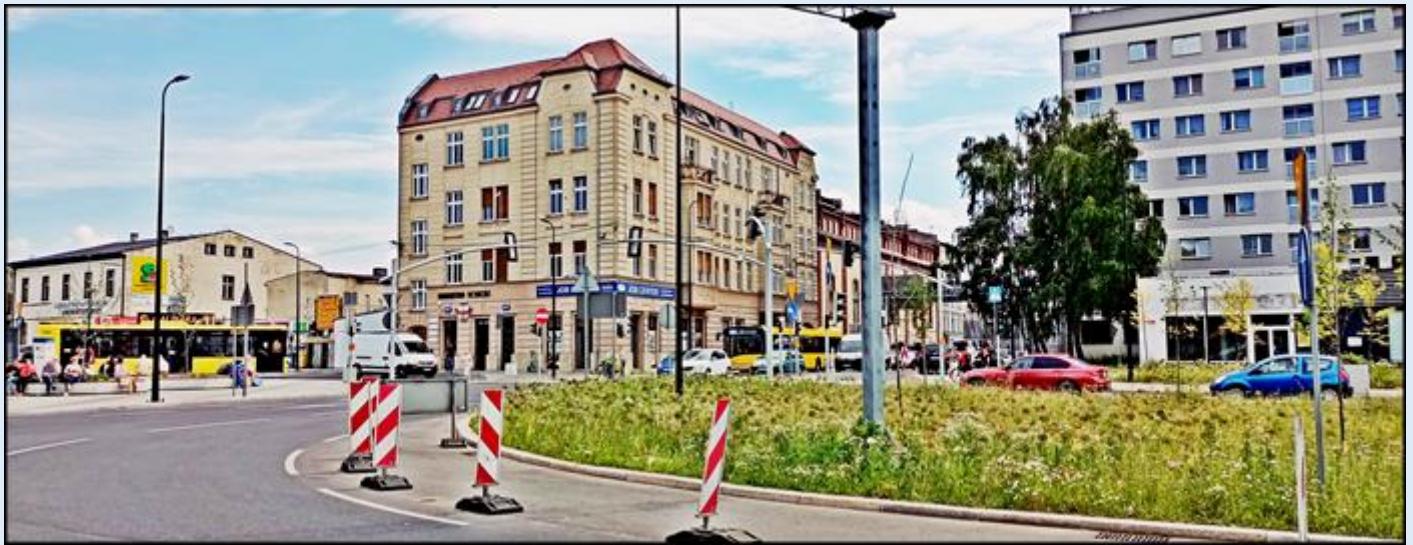
wygląd współczesny tego miejsca