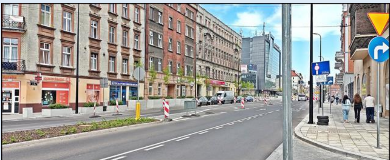
widok na ul. Bohaterów Getta Warszawskiego od strony południowej