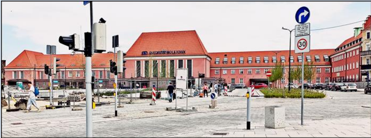
Dworzec PKP Głiwice – otwarty 2 października 1845 r. (obecnie plac w remoncie – 16.02.2023)