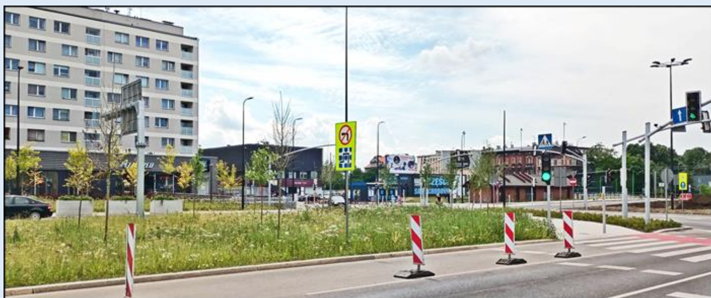
widok z miejsca pomnika w kierunku zachodnim, w ul. Dworcową