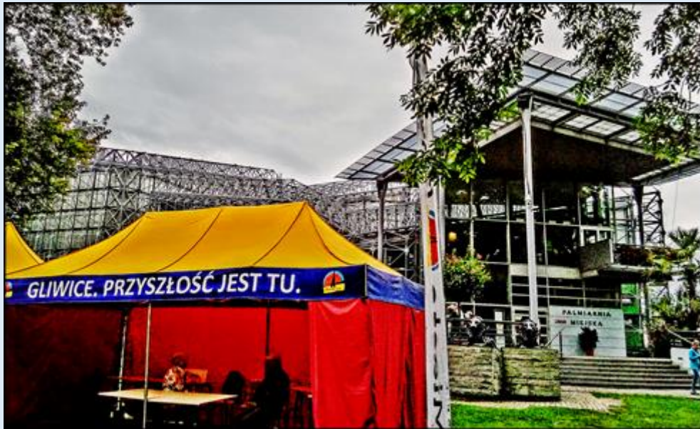
zob. Palmiarnia z 1924 r.