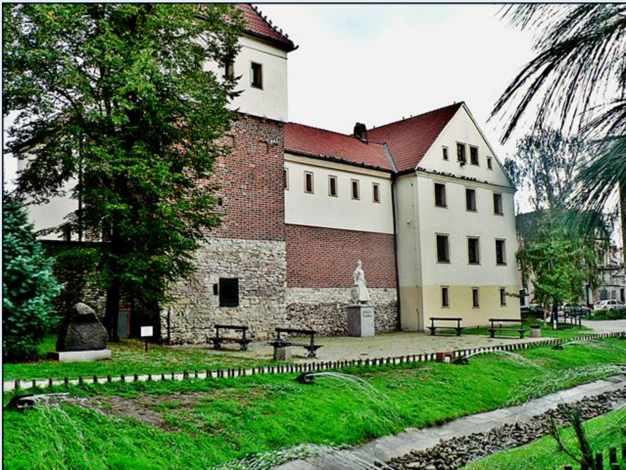
zdjęcie z odniesieniem do pomnika Batorego przed budynkiem pokazuje muzeum w Zameczku przy ulicy Pod murami 2 (opis: an) zob. Pomnik Stefana Batorego