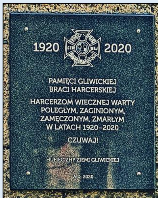
naścienne pamiątki religijno-patriotyczne