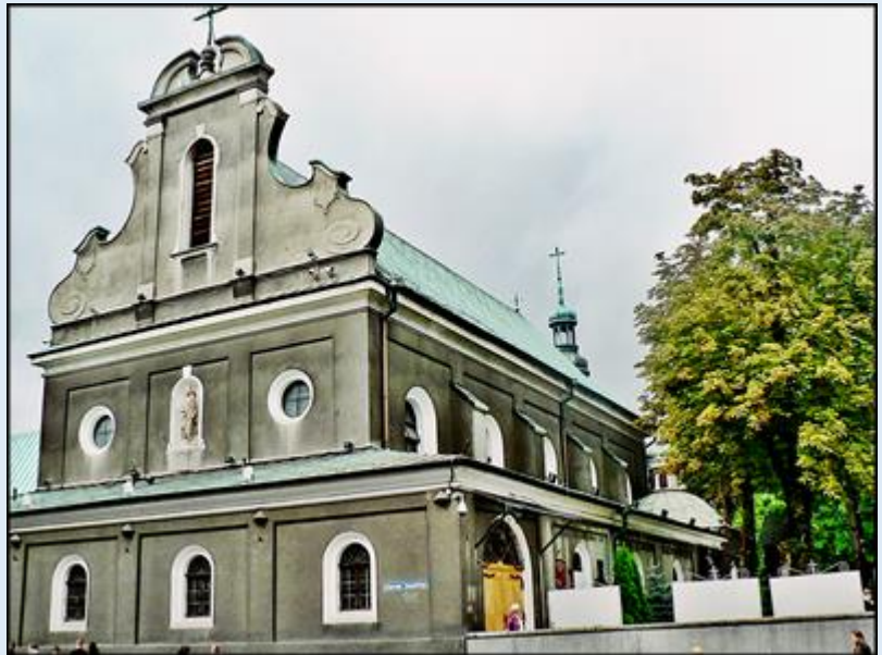
zob. Kościoły Gliwic