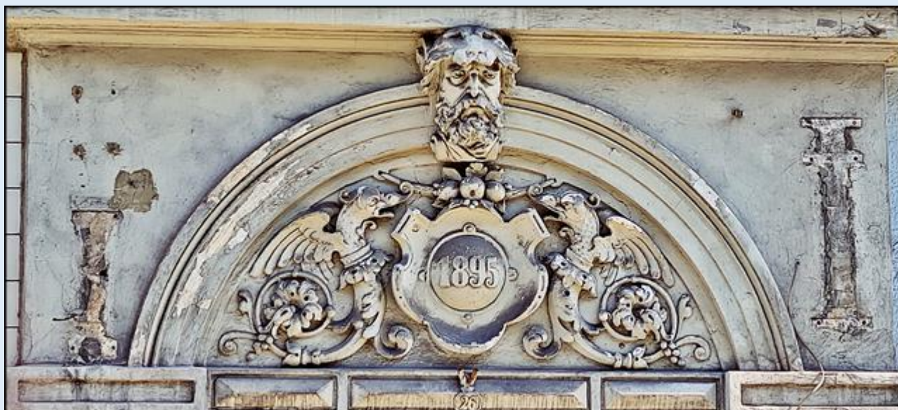
Portal nad wejściem do Komornika Sądowego