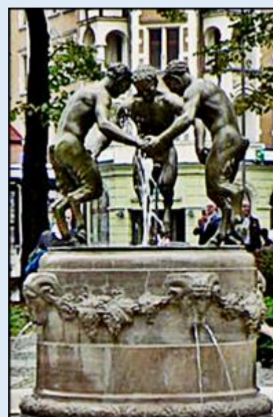
Fontanna z Trzema Faunami przed Urzędem Miasta