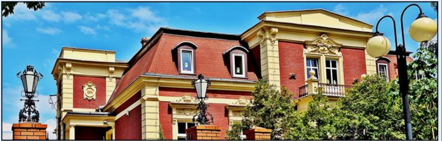
przykłady sztuki kowalskiej