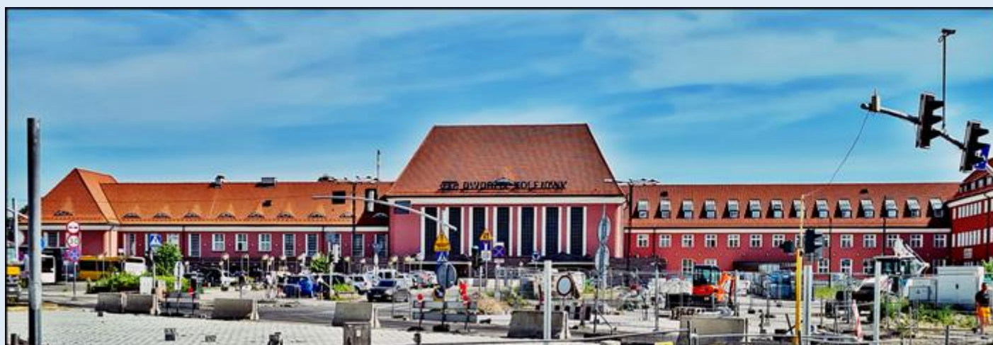
Budynek dworca kolejowego z czasie olbrzymiego remontu otoczenia