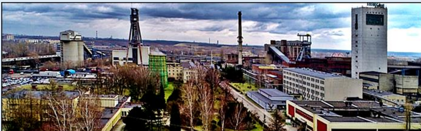
Kopalnia 'Sośnica'