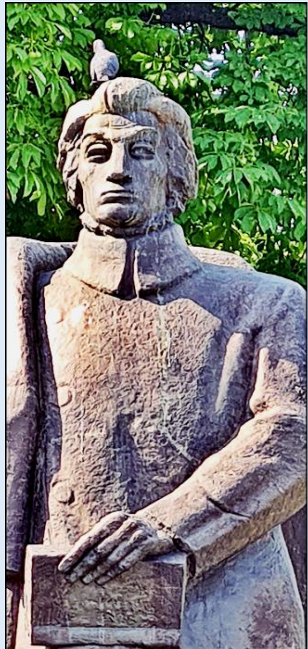
Pomnik Adama Mickiewicza natchnionego gołębkiem – symbolem Ducha Świętego