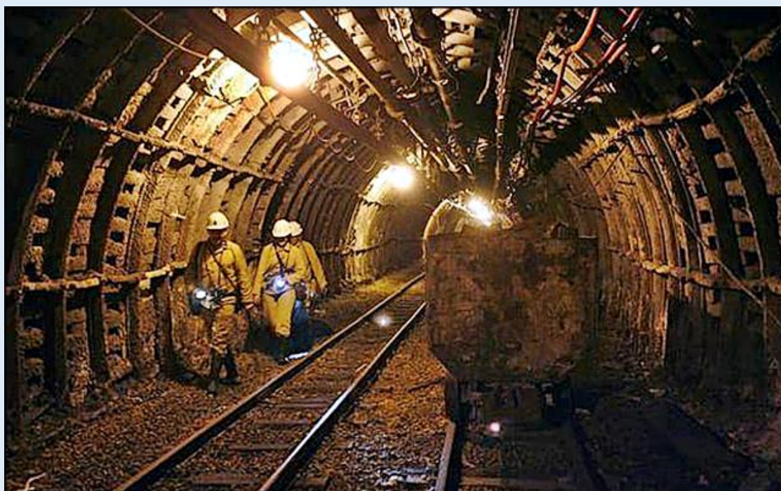
Kopalnia 'Sośnica' na dole - zdj. an - https://www.rp.pl/biznes/art15873491-kopalnia-sosnica-makoszowy-zagrozona