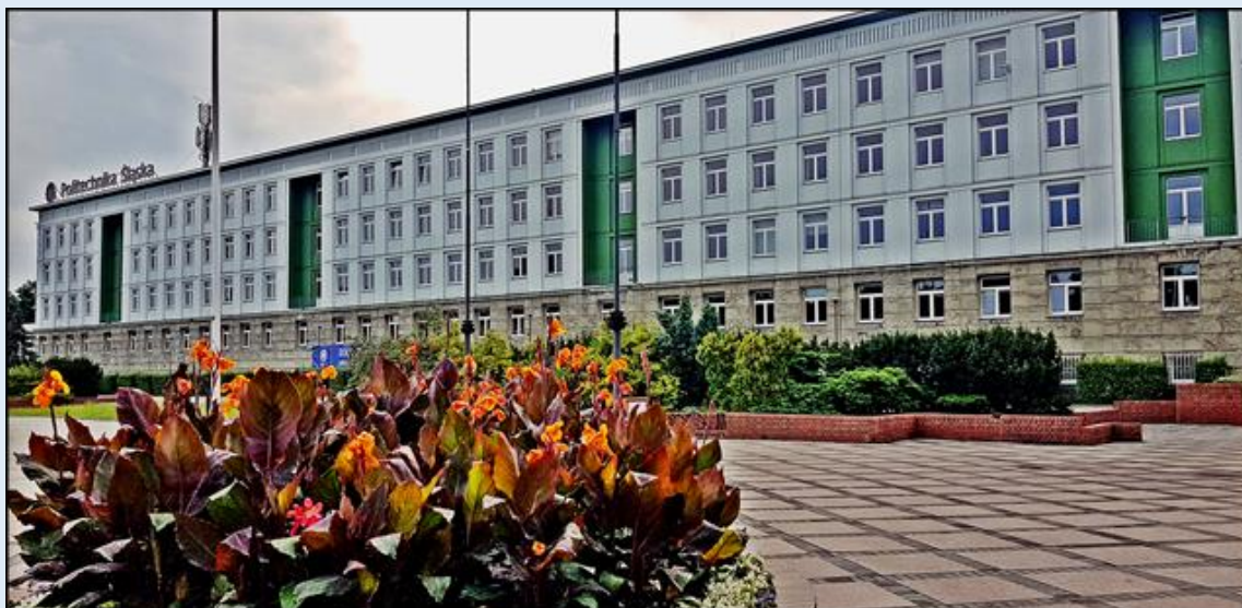
Budynek Wydziału Górniczego Politechniki Śląskiej, za którym znajduje się Kościół pw. św. Alberta Wielkiego