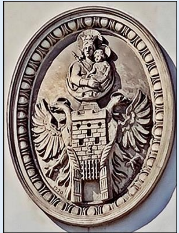
Ratusz na Rynku Miasta ze starym herbem na froncie