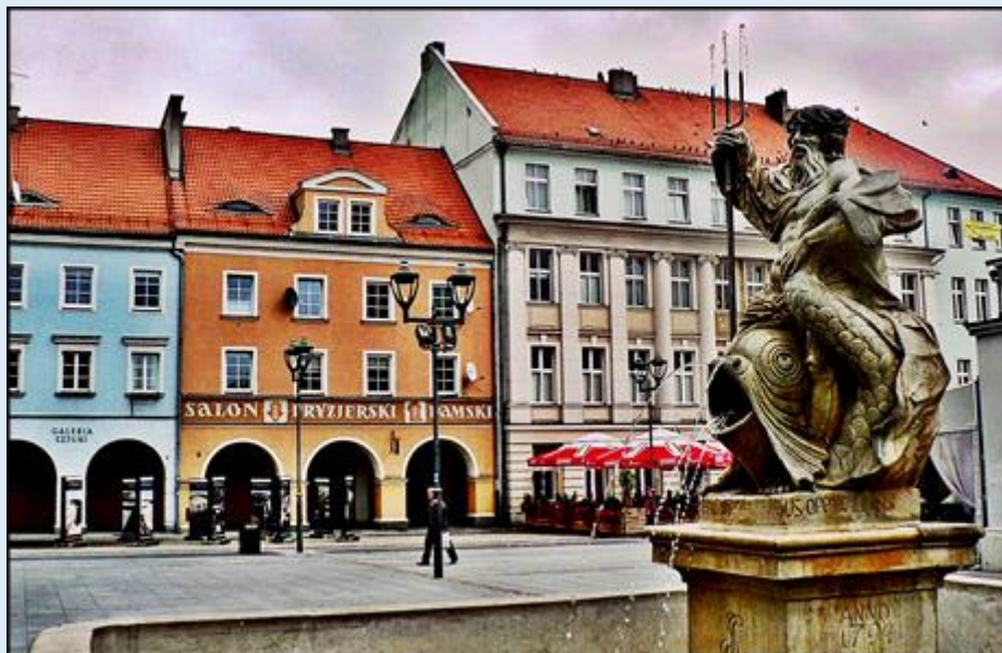
Pomnik Neptuna na Rynku Miasta z 1794 r.