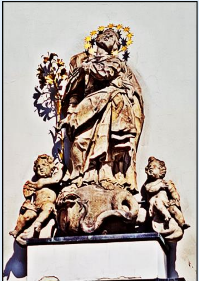
Boczna ściana Ratusza z rzeźbą MB