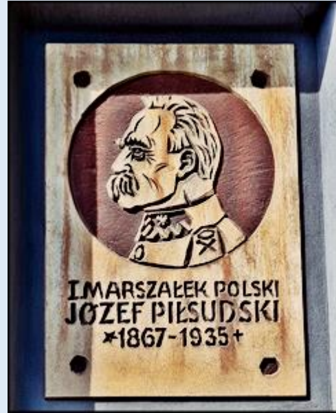
Pomnik Józefa Piłsudskiego na Placu jego imienia