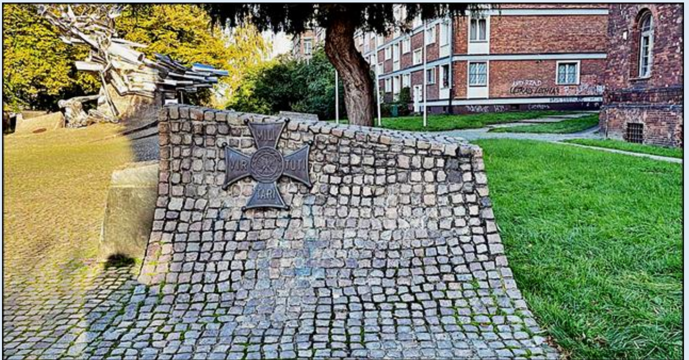
z lewej: Pomnik Obrońców Poczty Polskiej