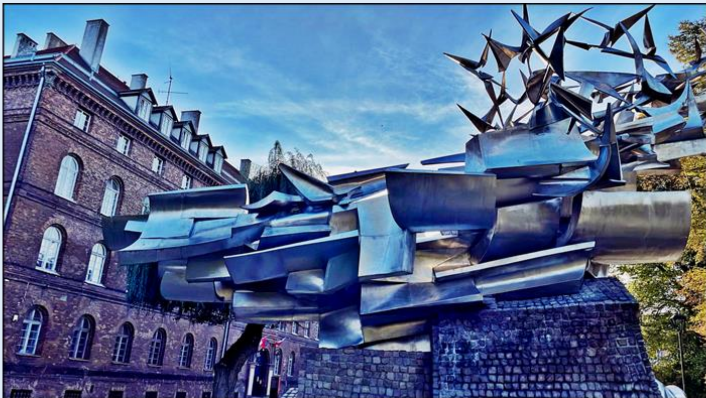
z lewej: Muzeum Poczty Polskiej