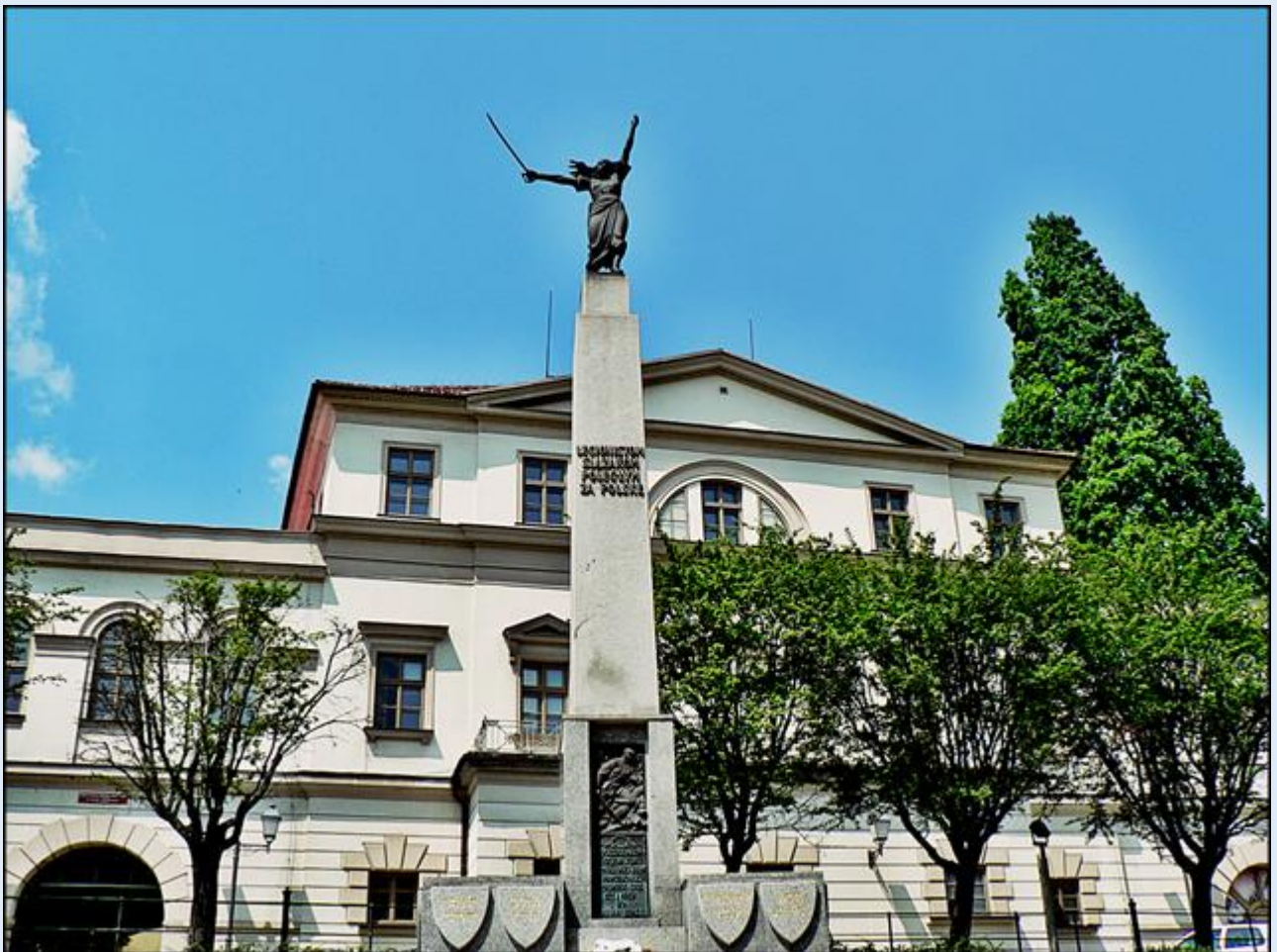
Pomnik Poległych Legionistów - 'Cieszyńska Nike'