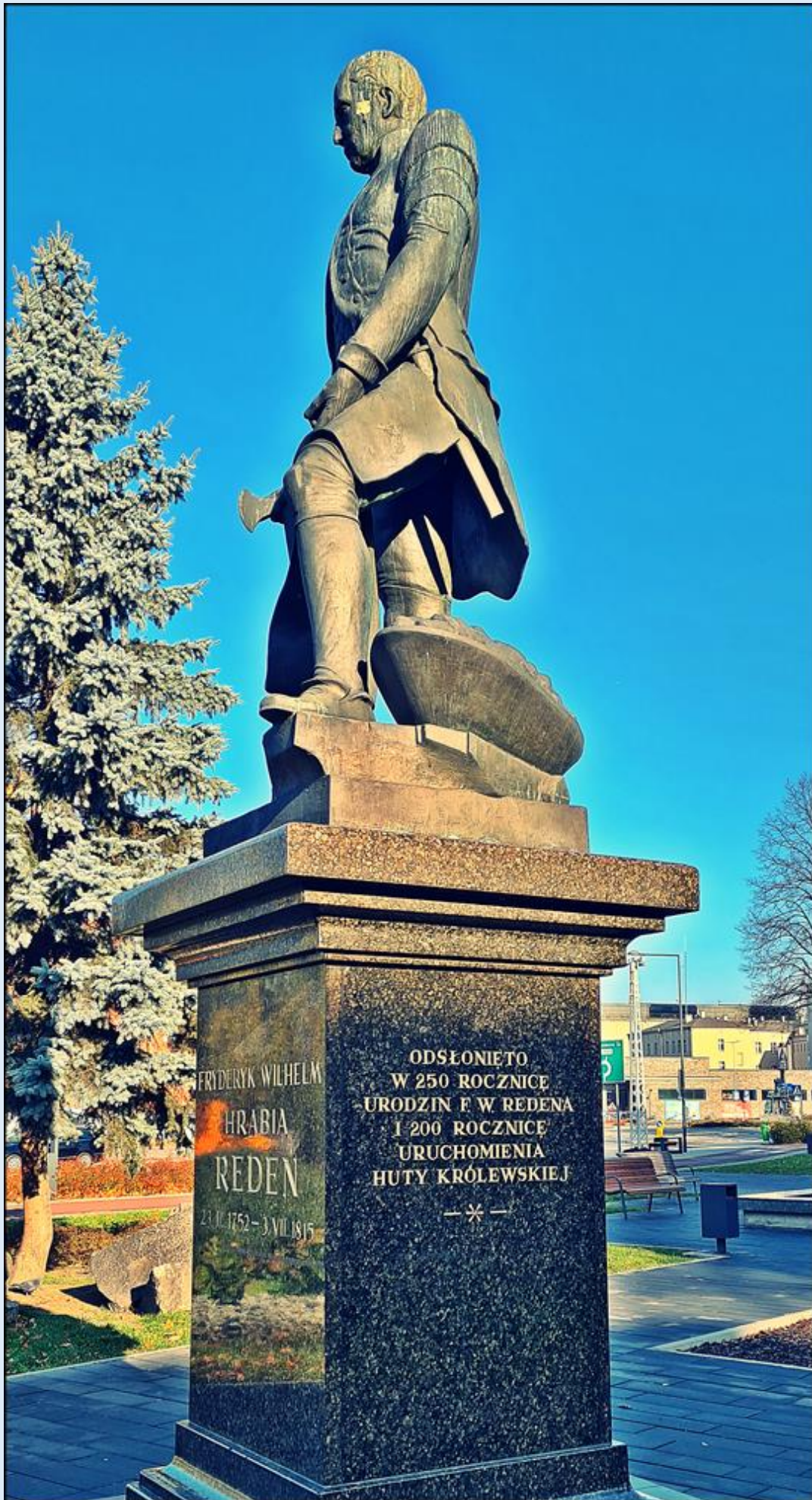
w tle na prawo Huta Królewska (obecnie Huta Kościuszko)