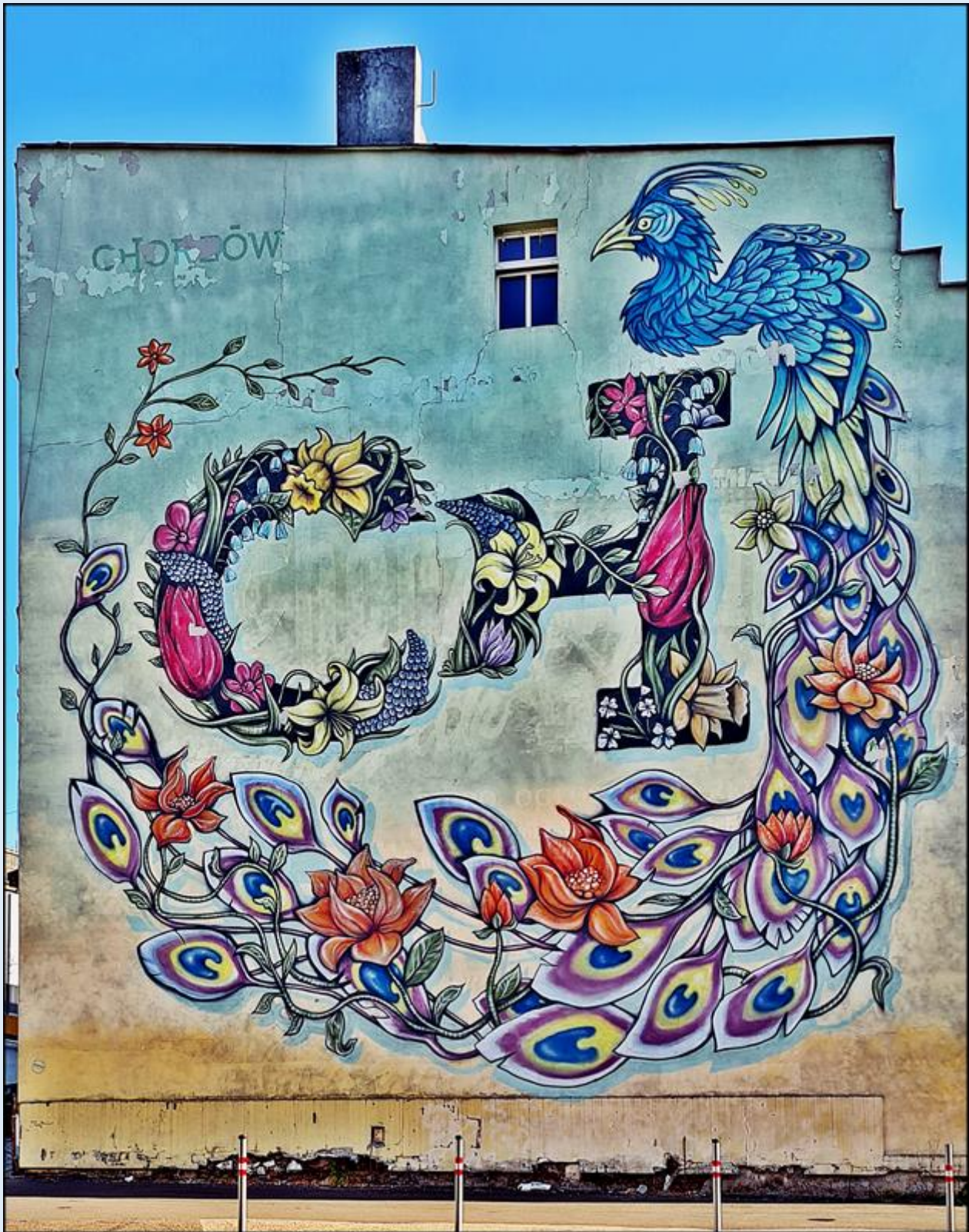
mural na pobliskim domu