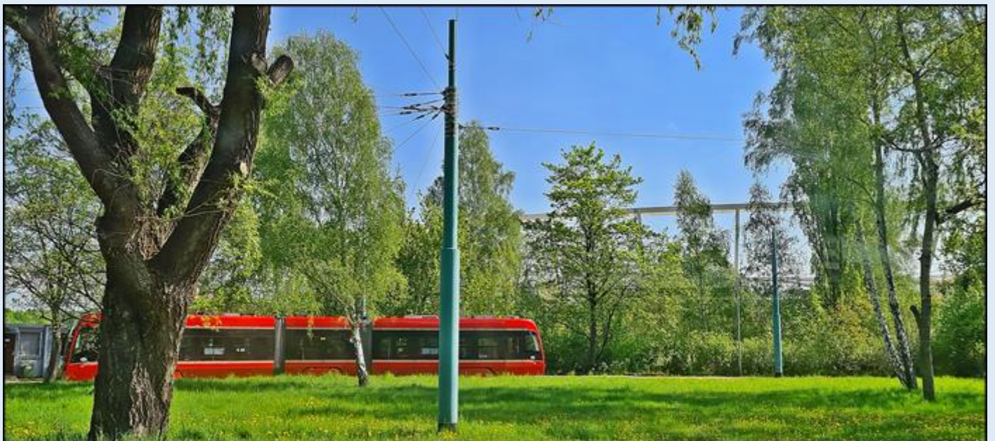
widok na stadion z tramwaju