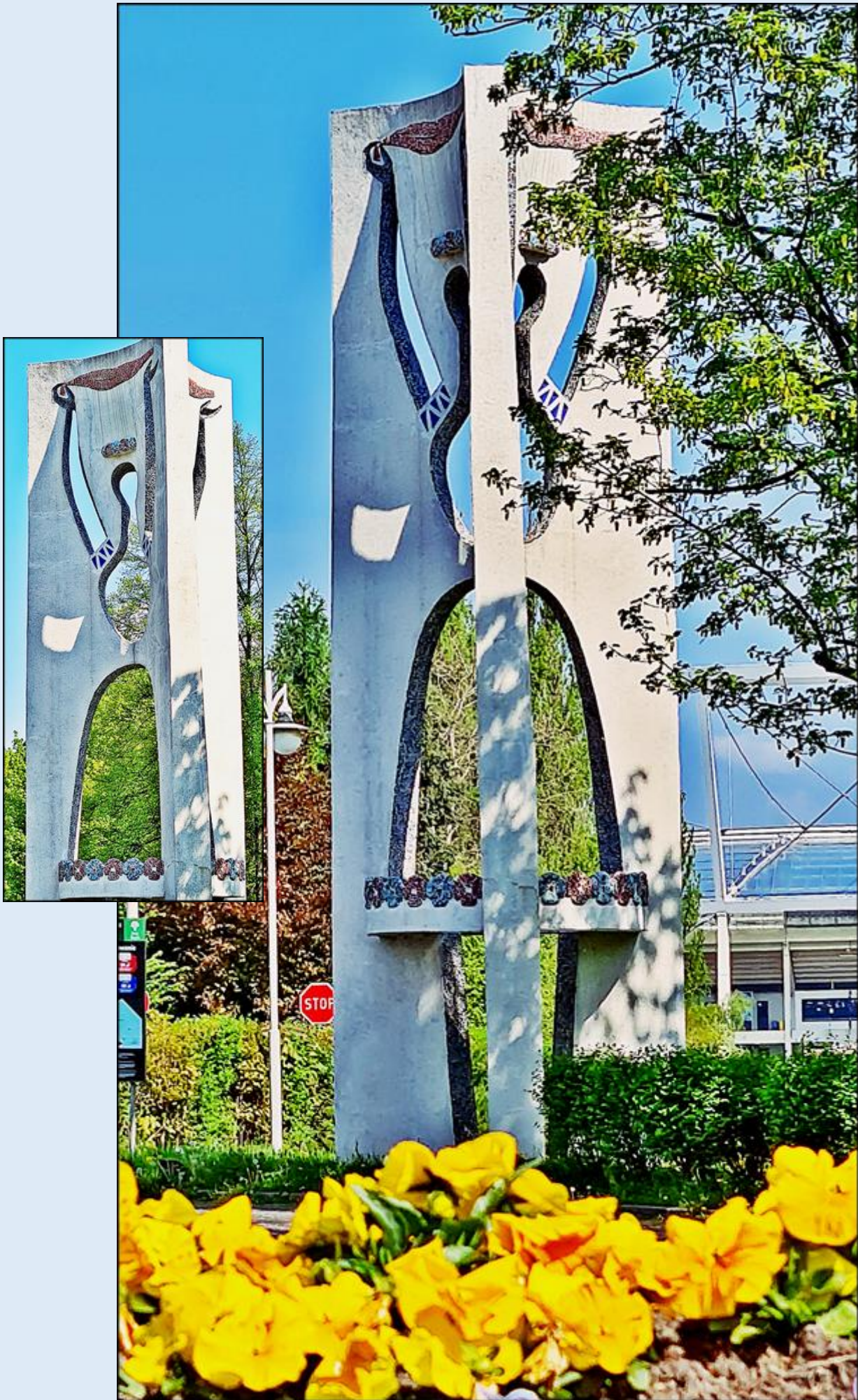
Z lewej strony przed głównym wejściem Tańcząca Ślązaczka