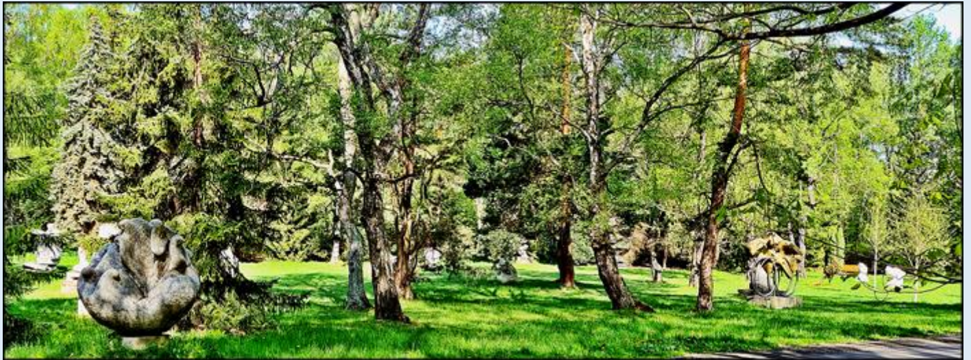
w niedalekiej odległości od planetarium znajduje się plenerowa Galeria Rzeźby Śląskiej