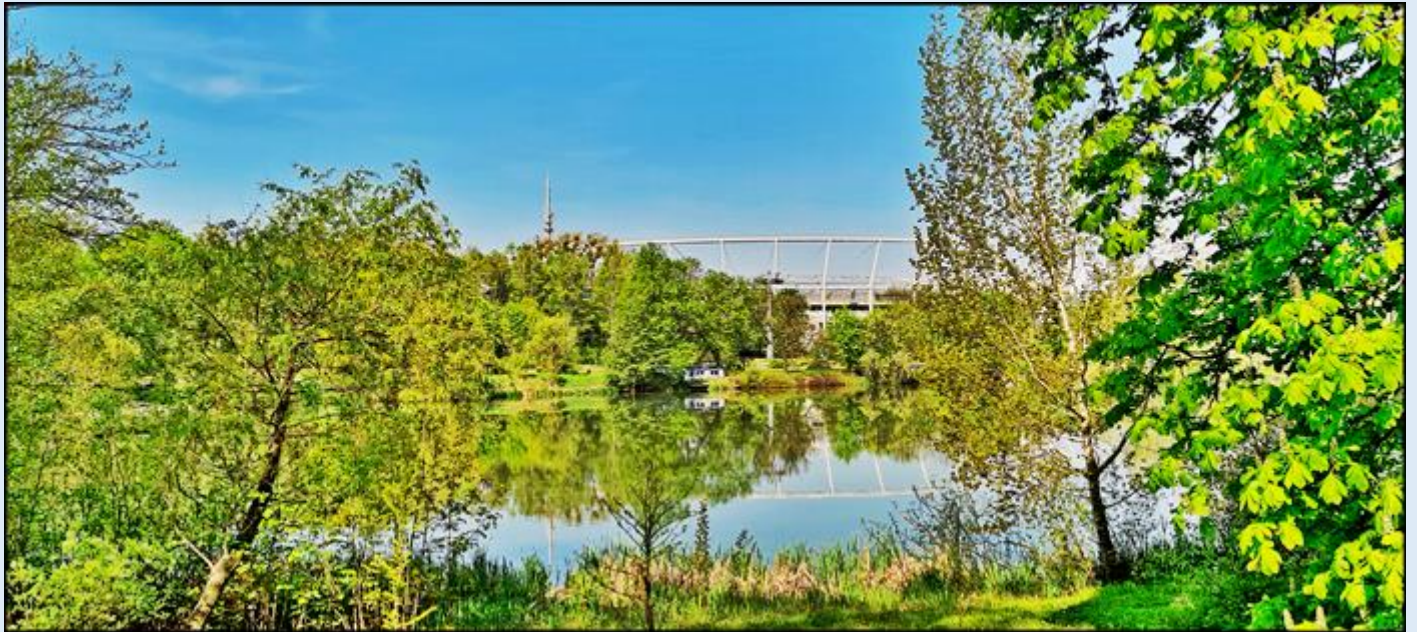
w oddali zadaszenie Stadionu Śląskiego