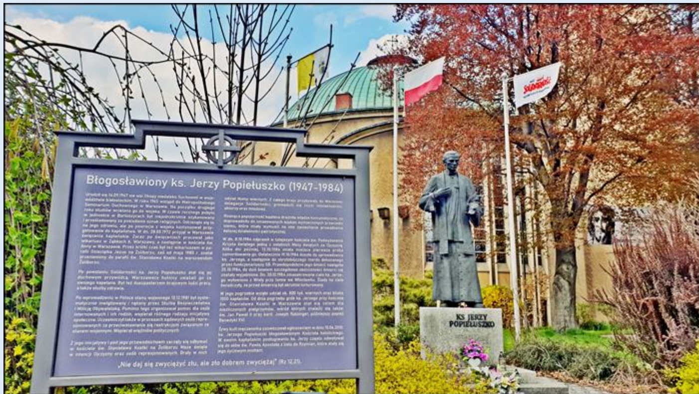
2.05.2022 – pojawiła się też tablica informacyjna