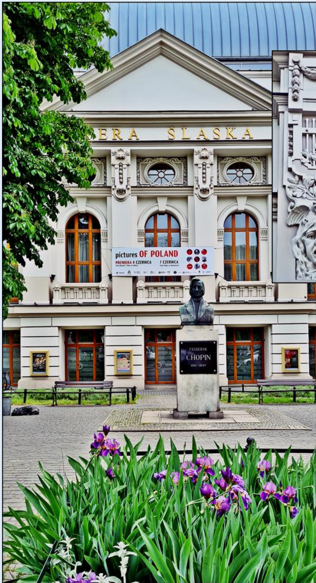
Boczna, zachodnia ściana Opery Śląskiej z popiersiem Fryderyka Chopina