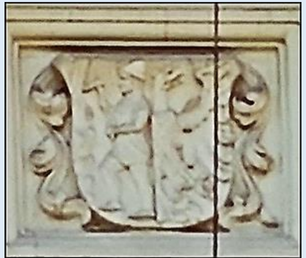
Ozdobna kamienica z płaskorzeźbami u szczytu z herbem Bytomia w centrum