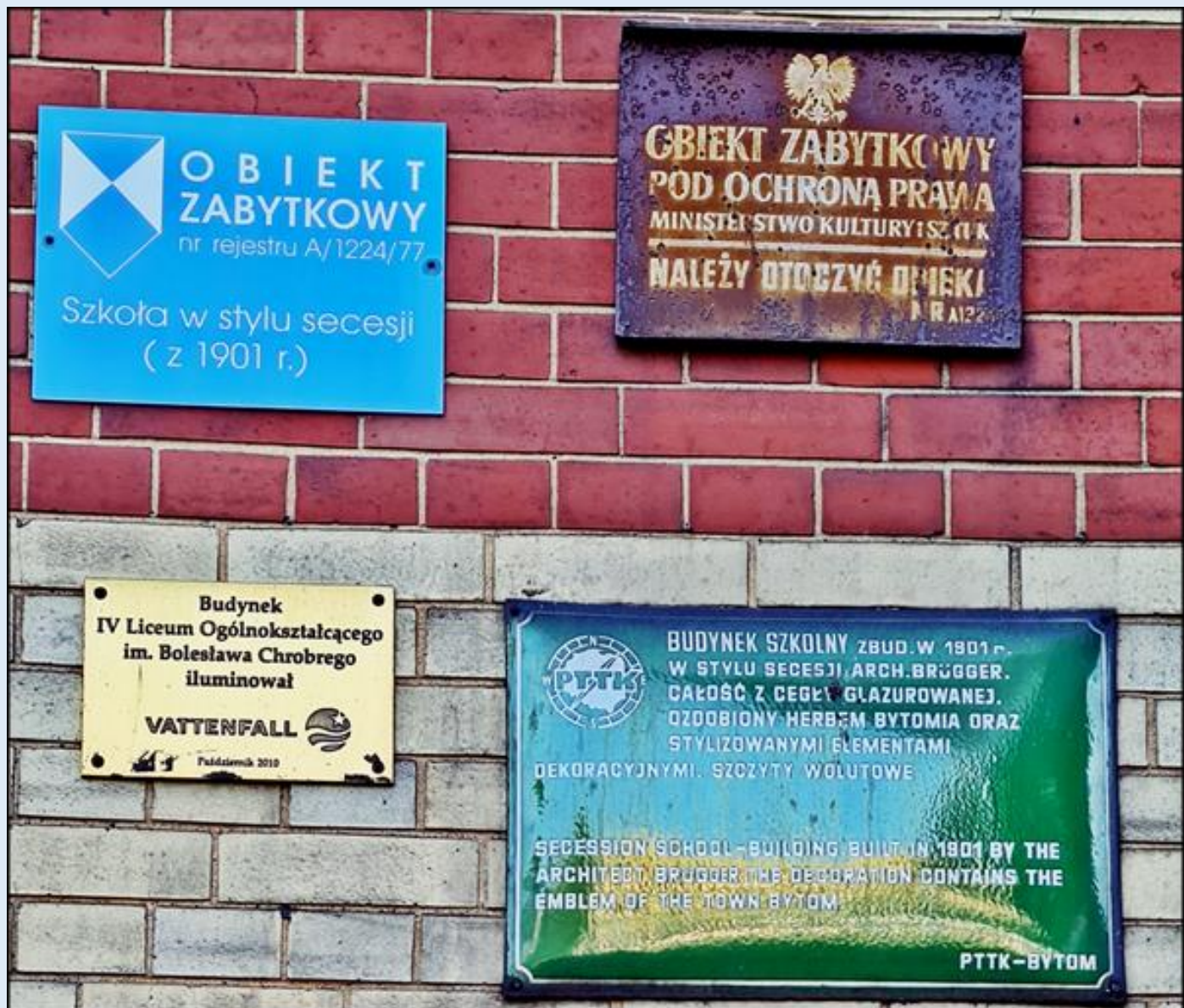
Tablice na budynku IV LO