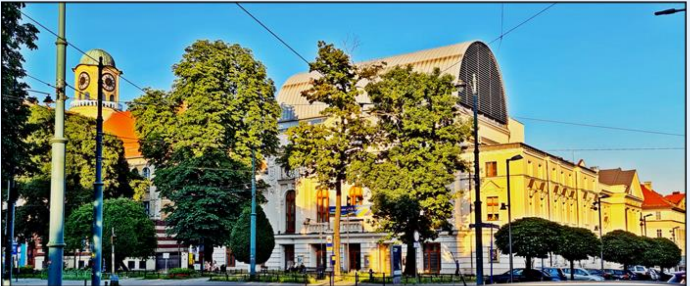
Z lewej: IV LO im. Bolesława Chrobrego, w centrum i na prawo: Opera Śląska