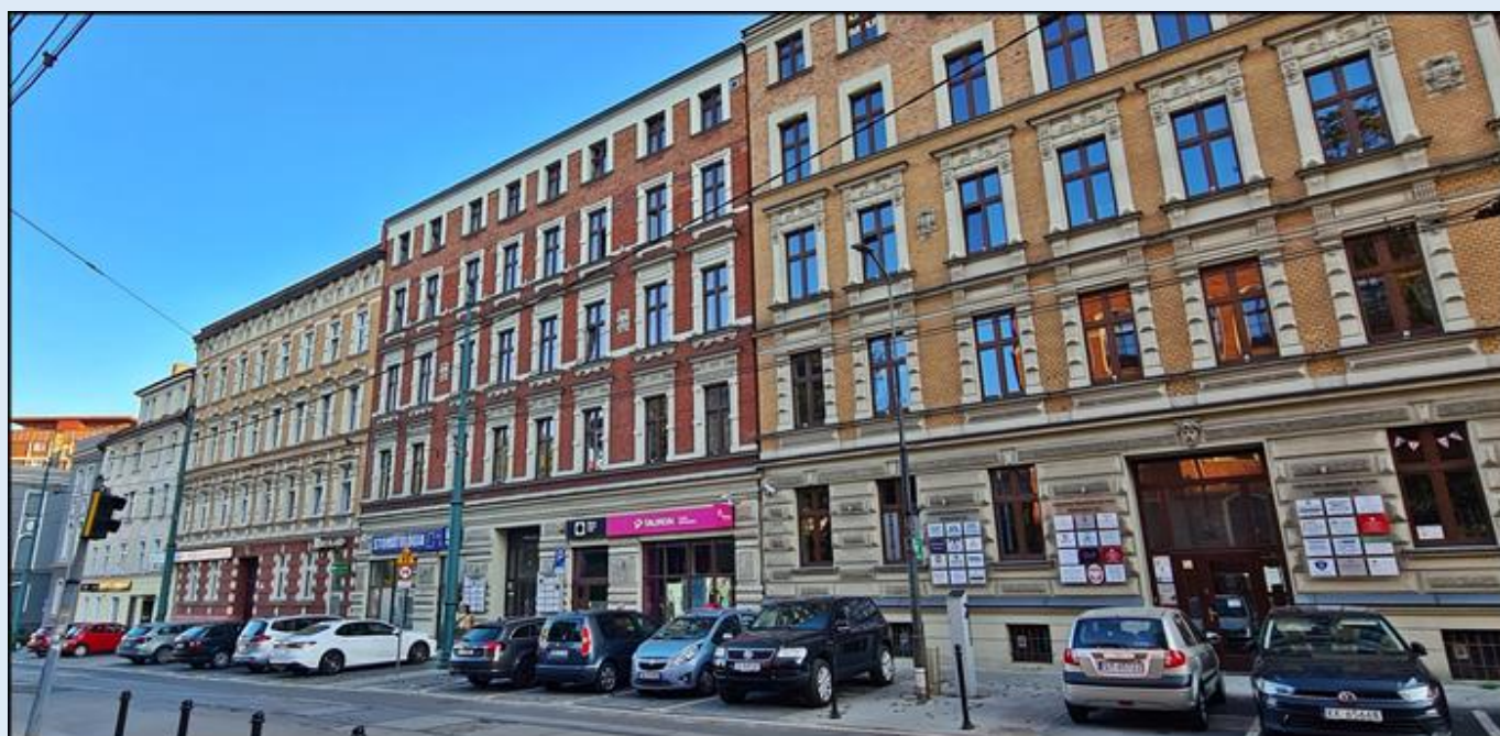
Kamienice po stronie południowej