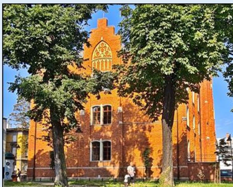
Ściana boczna Szkoły Muzycznej po stronie zachodniej placu