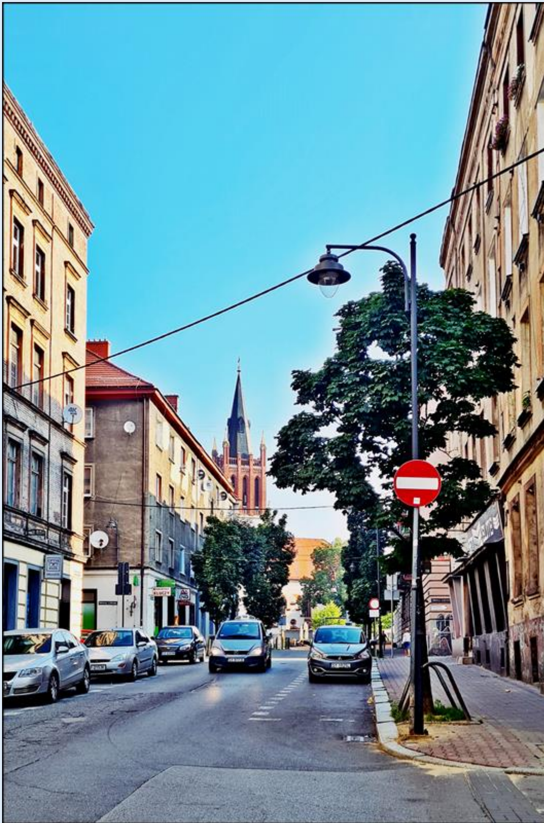
Widok od strony Placu Sikorskiego na ul. Piastów Bytomskich oraz Kościół pw. Wniebowzięcia NMP