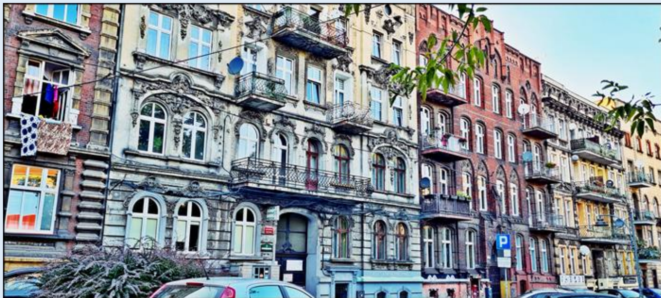
Kamienice po stronie zachodniej