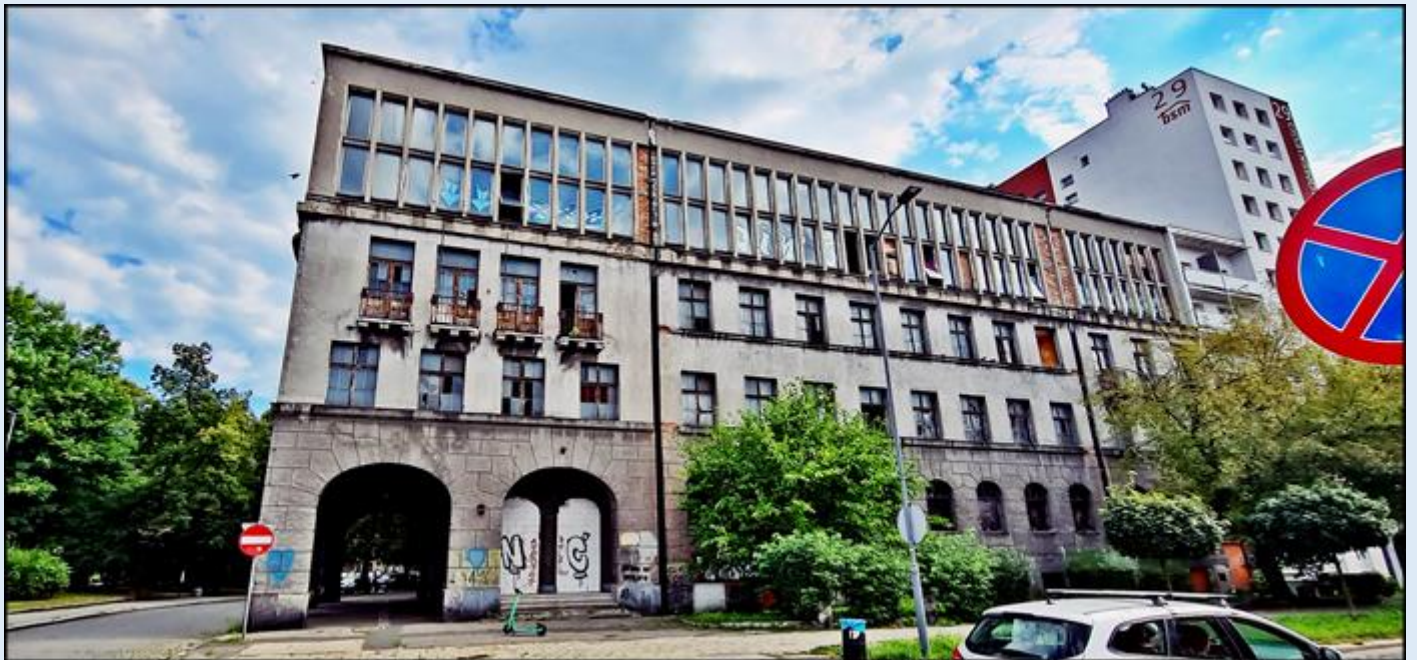
Na południowo-wschodnim narożniku Placu Akademickiego znajduje się zabytkowy budynek byłej PZPR. Obecnie bardzo zaniedbany i niszczyje jako pustostan.