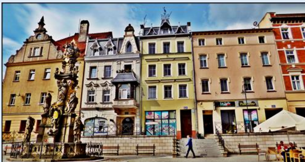
zob. Kolumna Świętej Trójcy