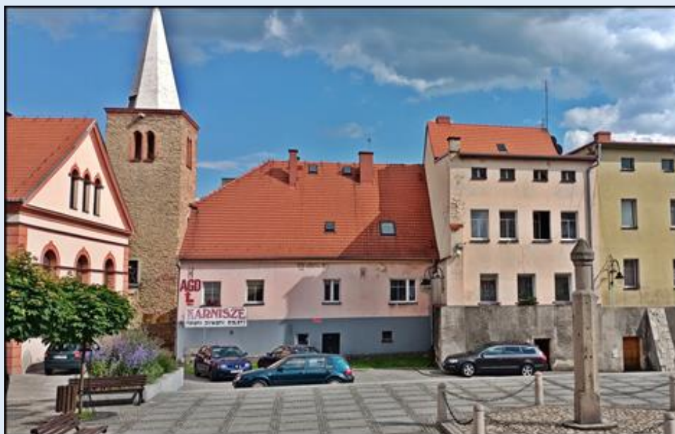
Z lewej: Baszta; z prawej: pręgierz