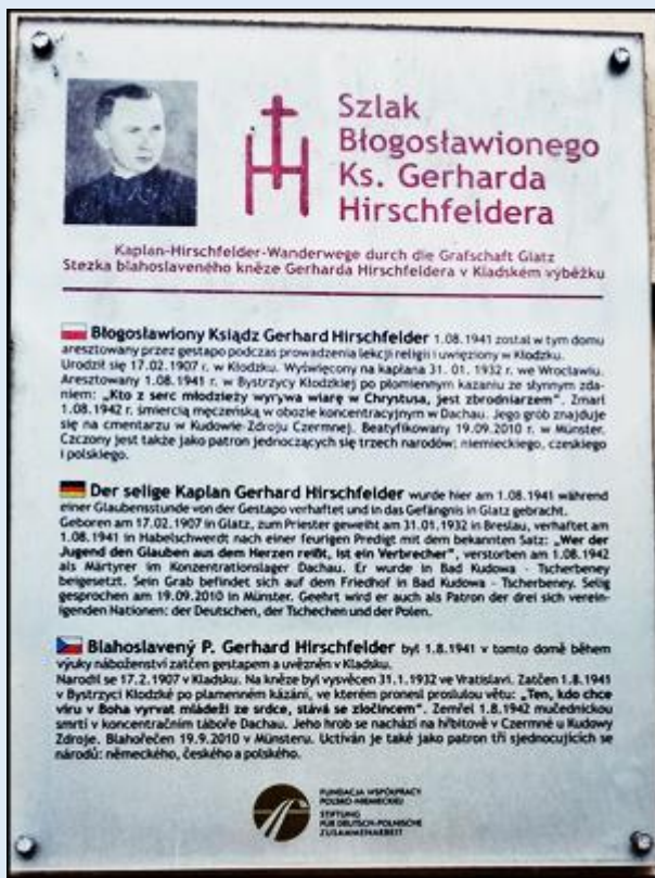
Bystrzyca Kłodzka - - Dom, w którym aresztowano bł. Gerharda Hirschfeldera