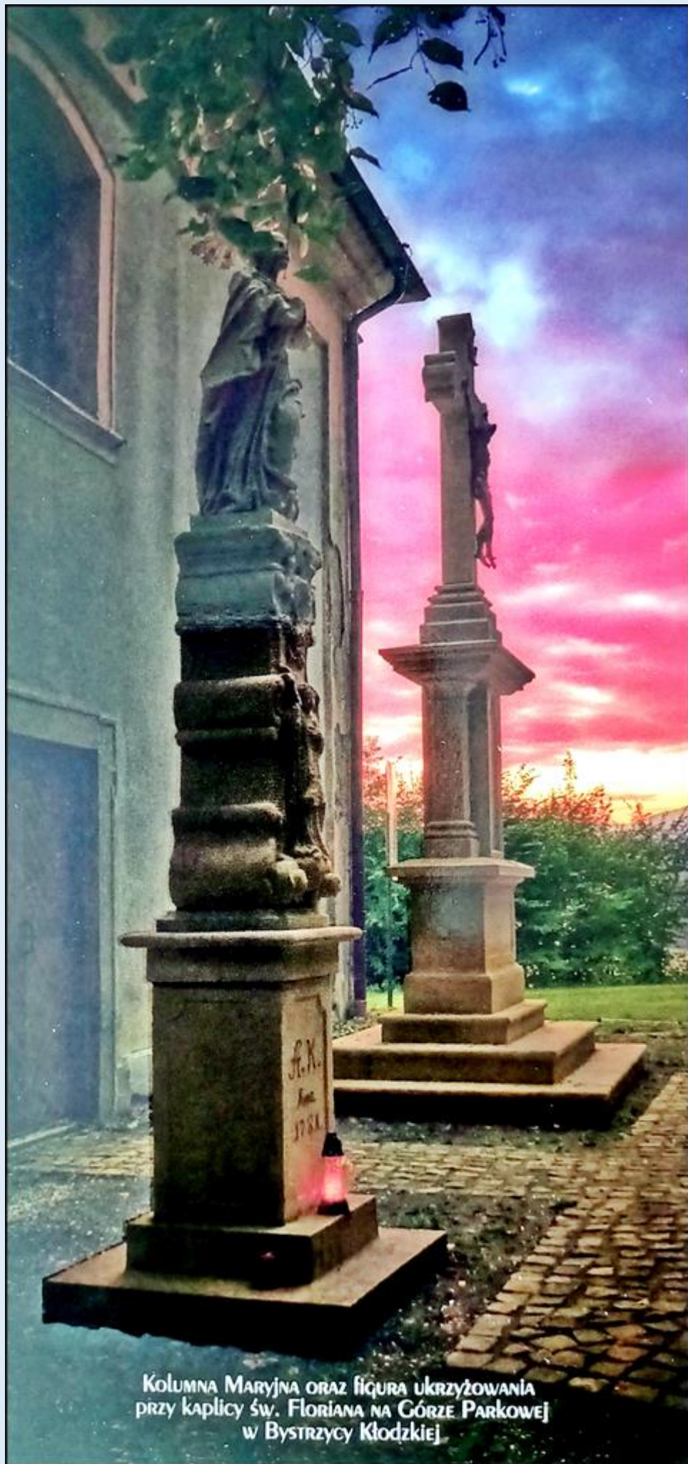
Kolumna Maryjna oraz figura ukrzyżowania przy kaplicy św. Floriana na Górze Parkowej w Bystrzycy Kłodzkiej.