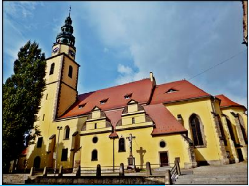
zob. Kościół pw. św. Michała Archanioła