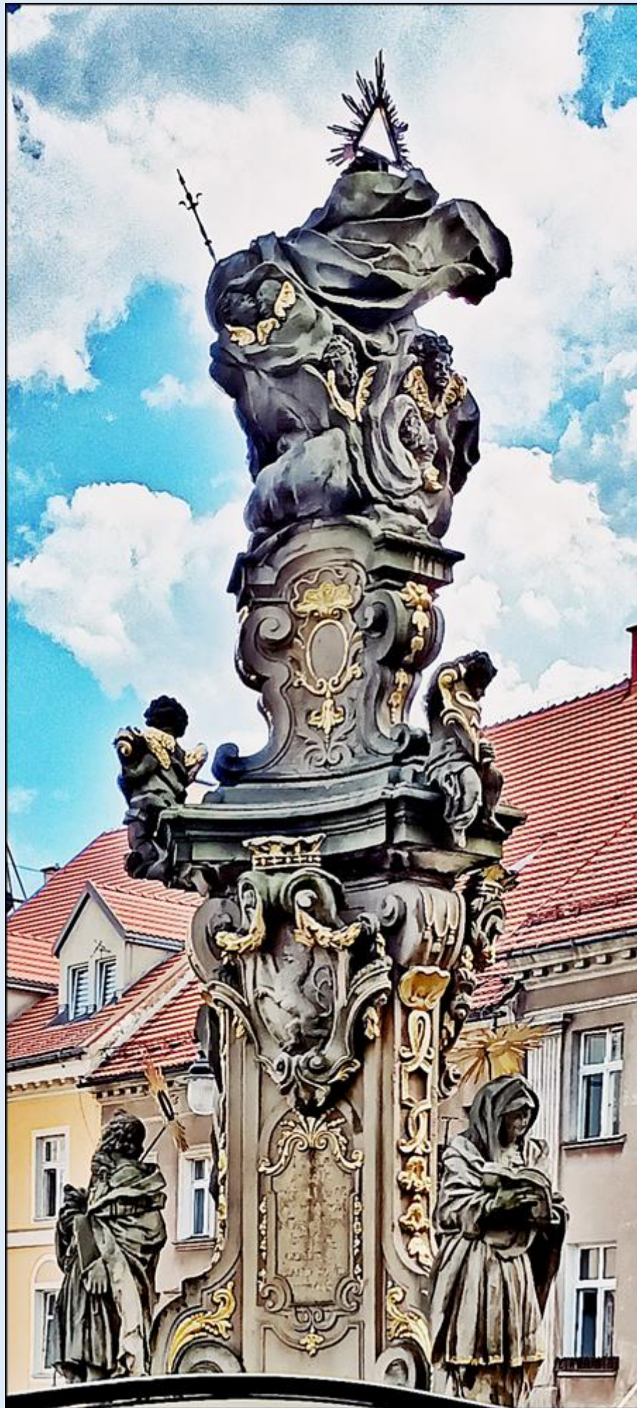
Kolumna Świętej Trójcy