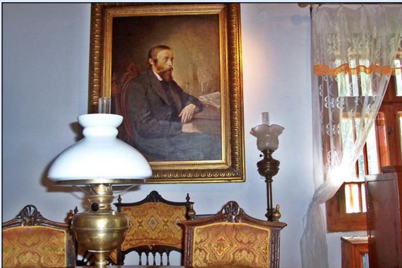
zob. Pomnik Ignacego Łukasiewicza obok muzeum