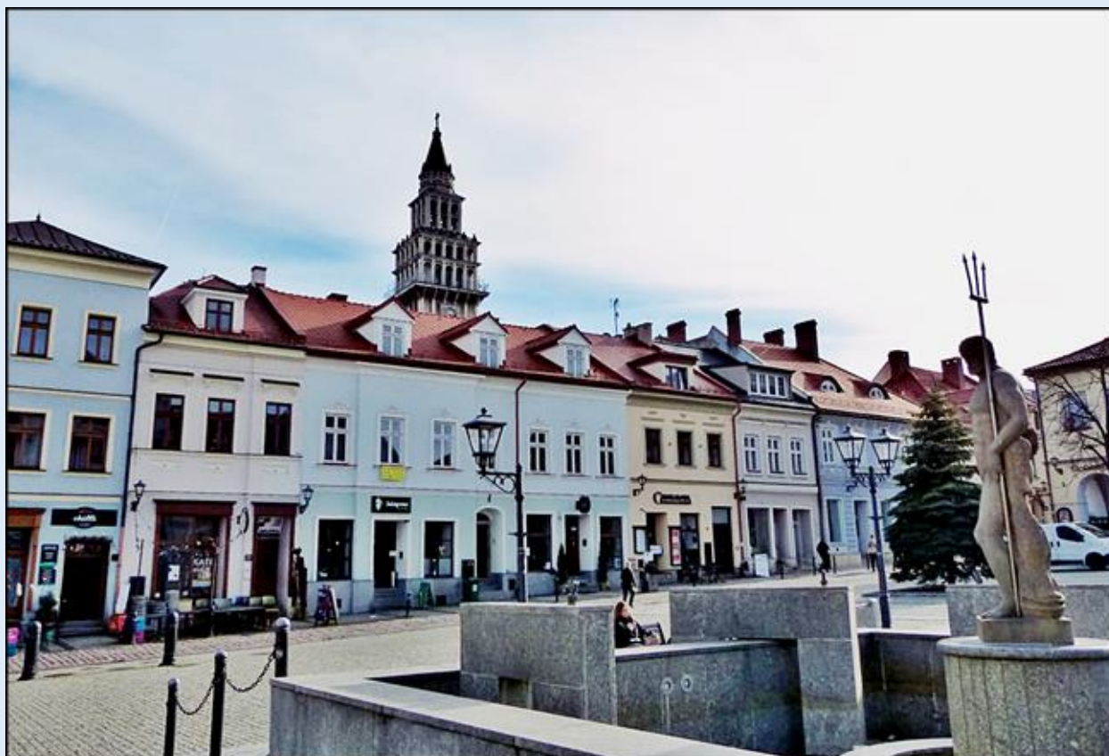
w tle: Katedra pw. św. Mikołaja