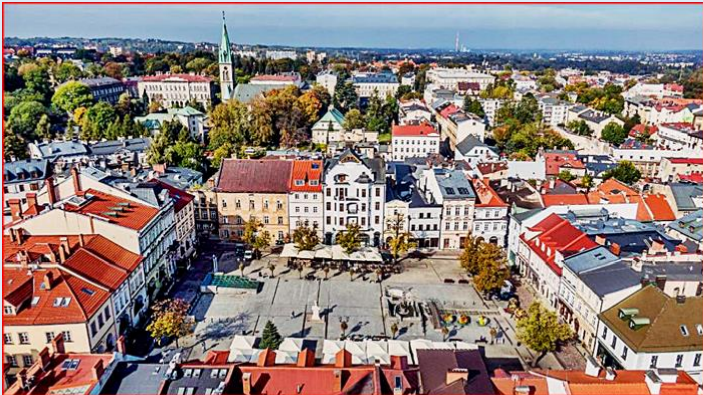
w tle: Kościół pw. Zbawiciela (ewangelicki)