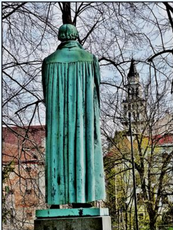
w tle: Kościół pw. św. Mikołaja