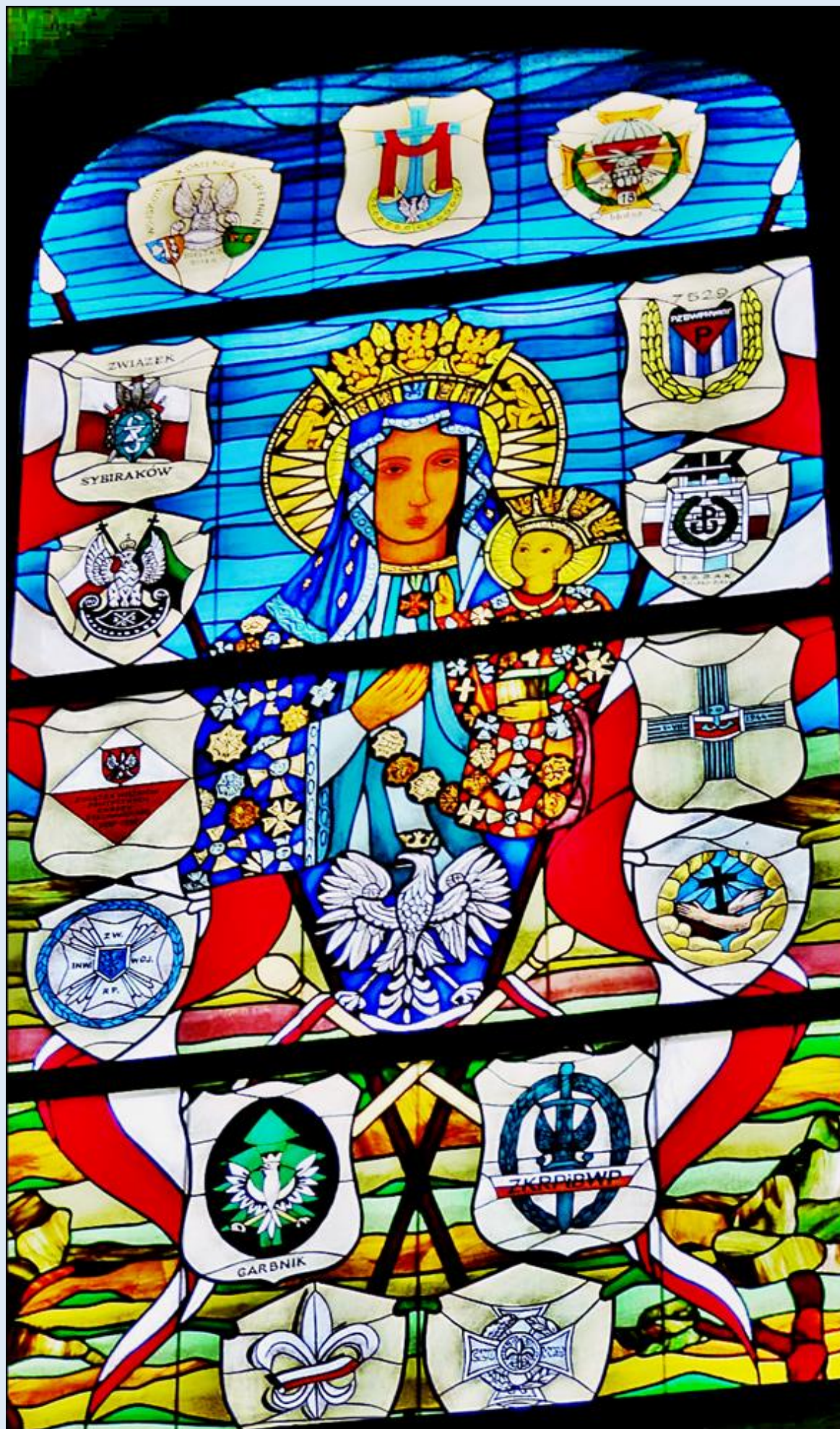
Kościół pw. Trójcy Przenajświętszej