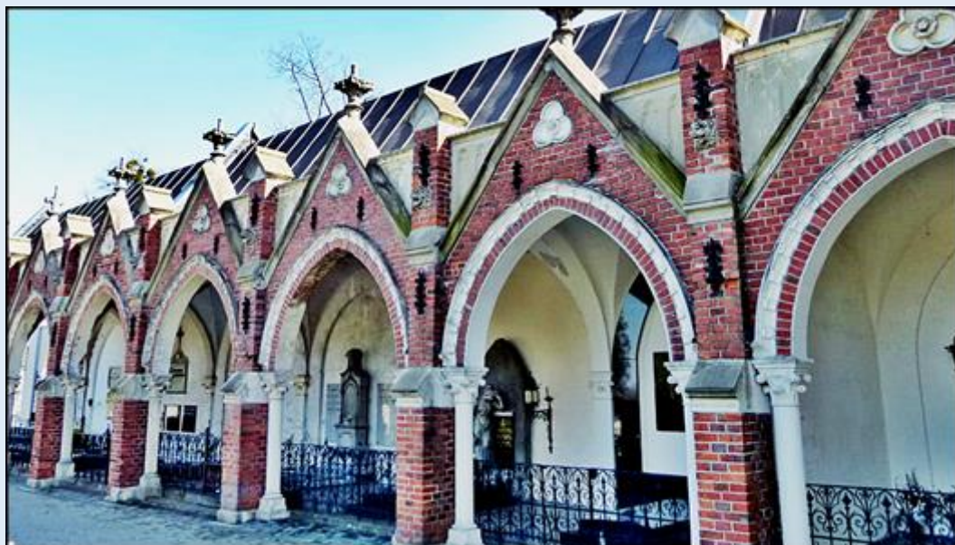
Cmentarz Rzymsko-katolicki na ul. Grunwaldzkiej