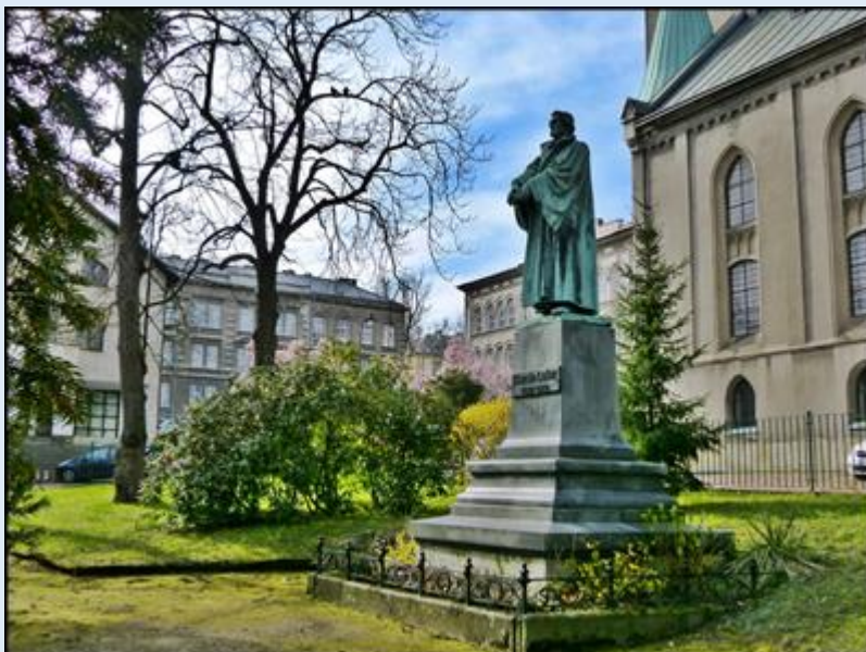
Park Juliusza Słowackiego - Pomnik Marcina Lutra