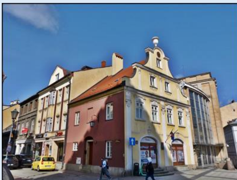
Bystra Śląska - Willa Juliana Fałata