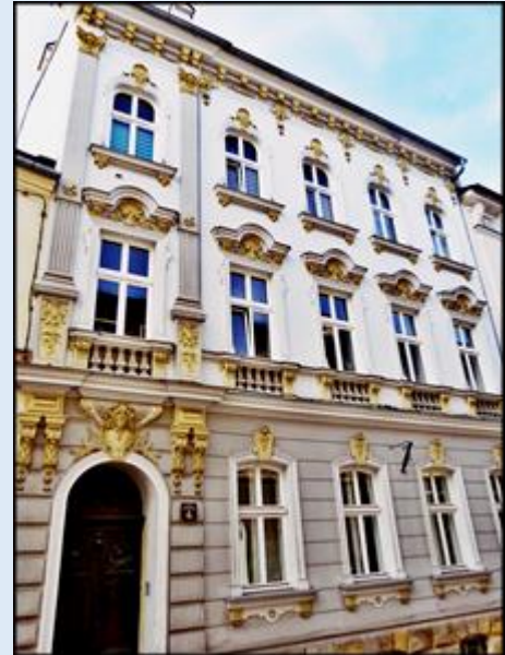
Przykłady zabytkowych kamienic