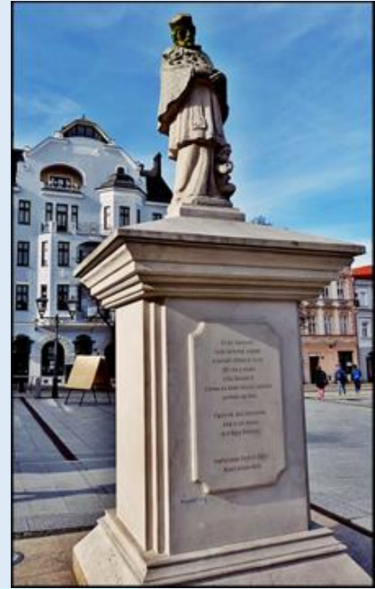
Rynek - Pomnik św. Jana Nepomucena z 1740 r.