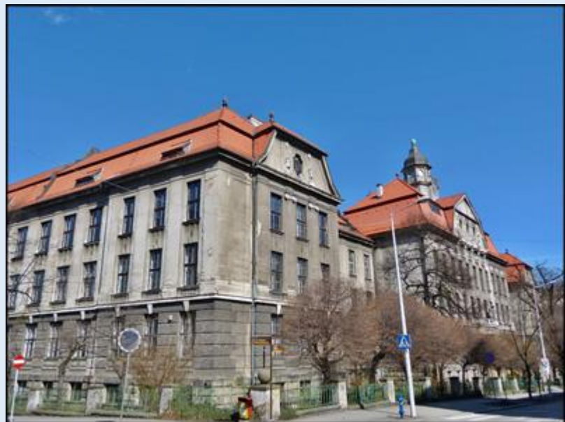
Muzeum Historyczne - Państwowa Szkoła Przemysłowa