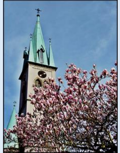
zob. Kościoły Bielska-Białej