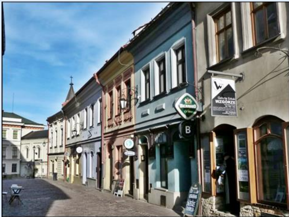
Galeria Sztuki 'Wzgórze'