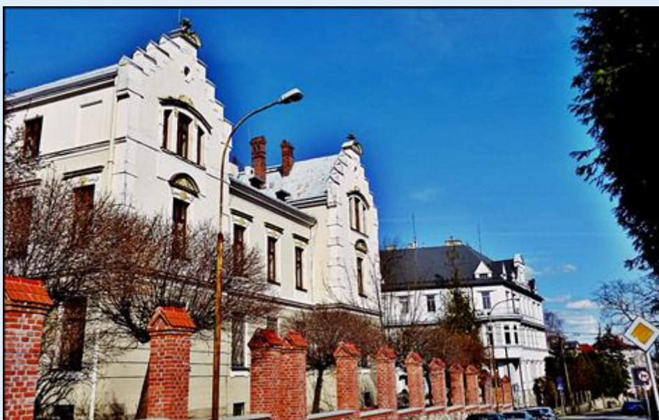
Prokuratura Rejonowa Bielsko-Biała Północ