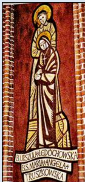
M63,7- Warszawa, fk w ko św. Stanisława bpa;