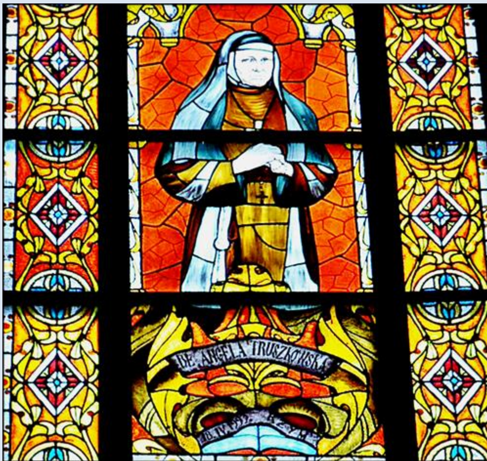
Warszawa, witraż w Kościele pw. śś. Apostołów Piotra i Pawła

http://www.felicjanki.pl/bl-maria-angela/