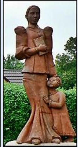
1. Szczurowa, MAŁ, fg z 1989 r. k. ko paraf.; 2. Lipnica Murowana, MAŁ, fg k. ko paraf.;