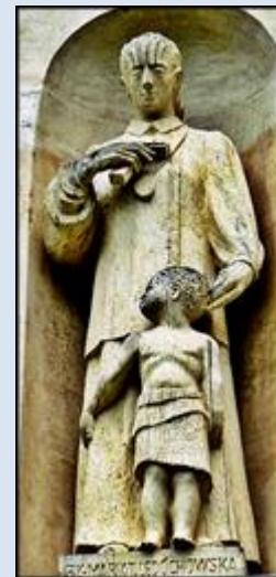
6. Zajączki, ŚLS, fk w ko św. Franciszka; P2180234,9- 3.V.'15 M11,7 – Zakopane – Top. Cyrhla, wt w ko Miłosierdzia Bożego; M11,8 – Muszyna, MAŁ, fg w fasadzie ko św. Józefa;