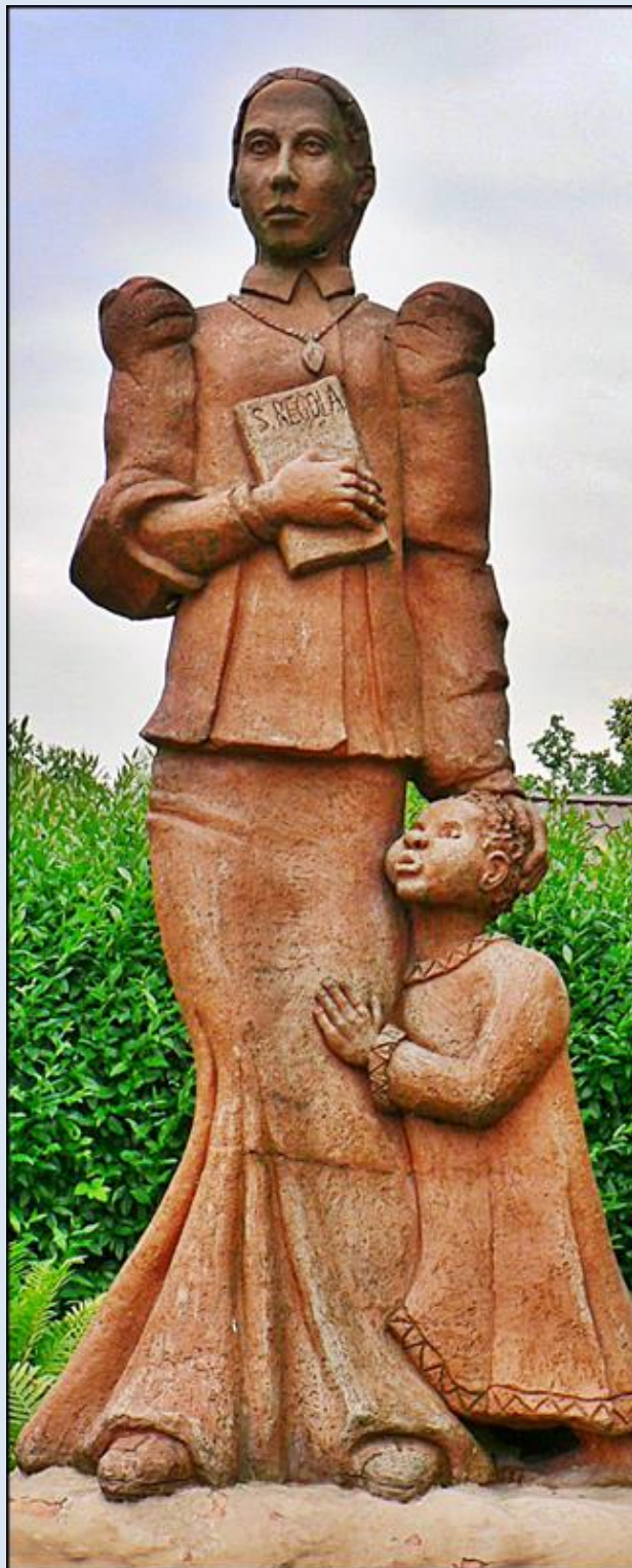
Lipnica Murowana, MAŁ, figura k. kościoła paraf.

https://brewiarz.pl/czytelnia/swieci/07-06a.php3