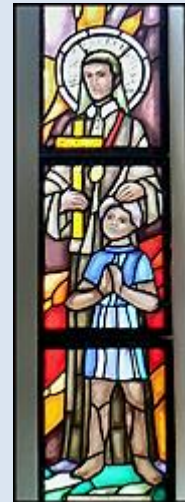
3. Portugalia – Fatima, galeria przy ko Trójcy Przenajśw.; P1860572- 7.VII.'12; 4. Dobryczyce, wt w ko św. Bartłomieja; 5. Kąclowa, MAŁ, wt w ko WNMP;