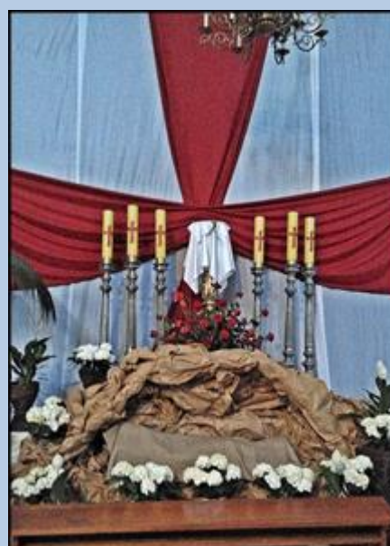
Grób Pański 2019