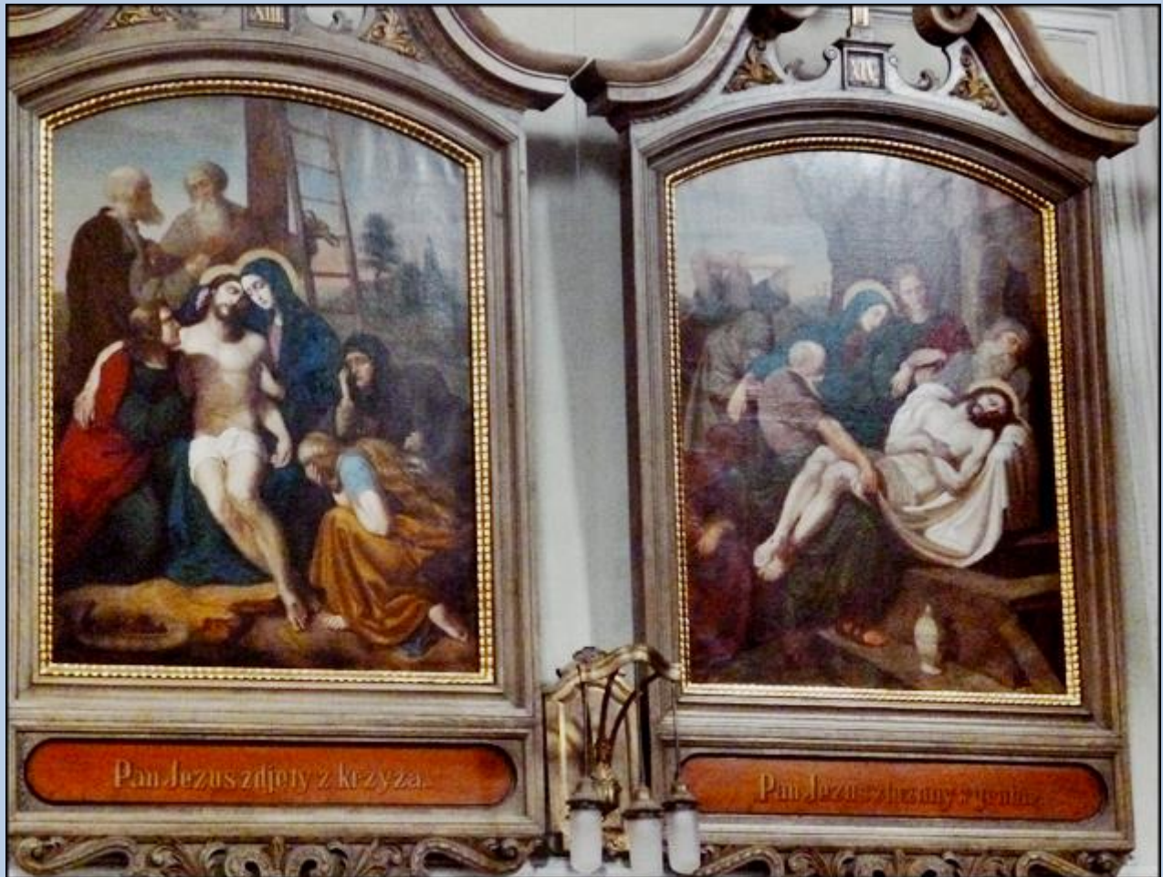
Pan Jezus zstąpił z krzyża.