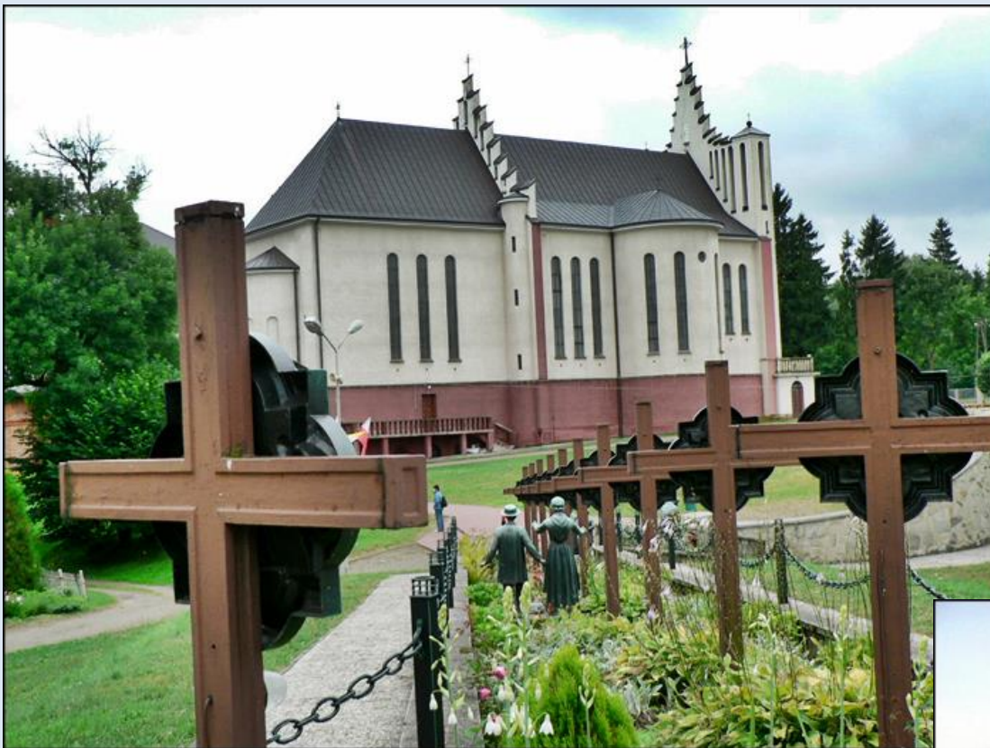
Polskie La Salette w Dębowcu

Autor tekstu i zdjęć, Jan Nitecki, w obłokach mgieł La Salette zob. też: http://nitecki.wietrzykowski.net/Nitecki_Francja_La.Salette_JN.pdf http://nitecki.wietrzykowski.net/Nitecki_MB_z.La.Salette.pdf