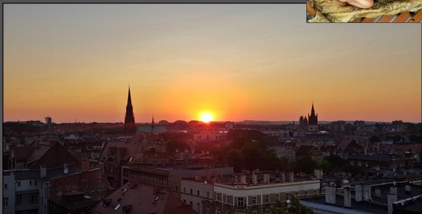
(Bytom, 1.07.2019)