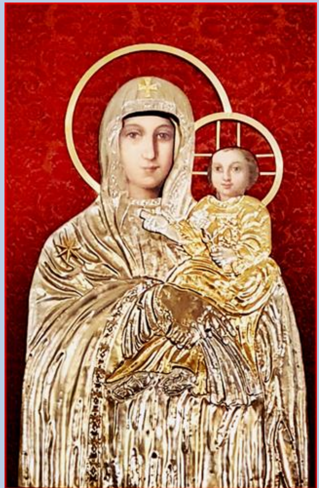
Kaplica MB Śnieżnej