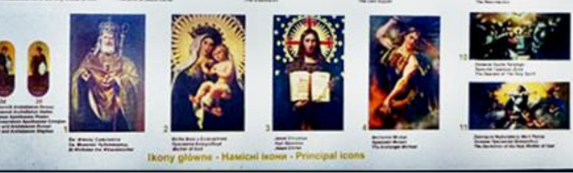
Ikony główne - Главные иконы - Principal icons