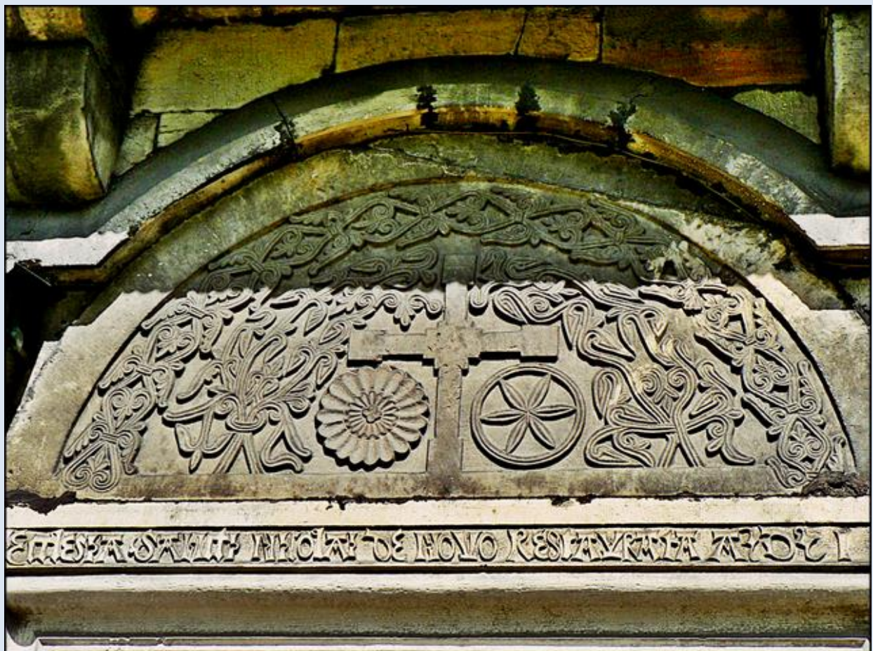
KOŚCIÓŁ ŚW. MIKOŁAJA PONOWNIE ODRESTAUROWANY W ROKU PAŃSKIM 1901