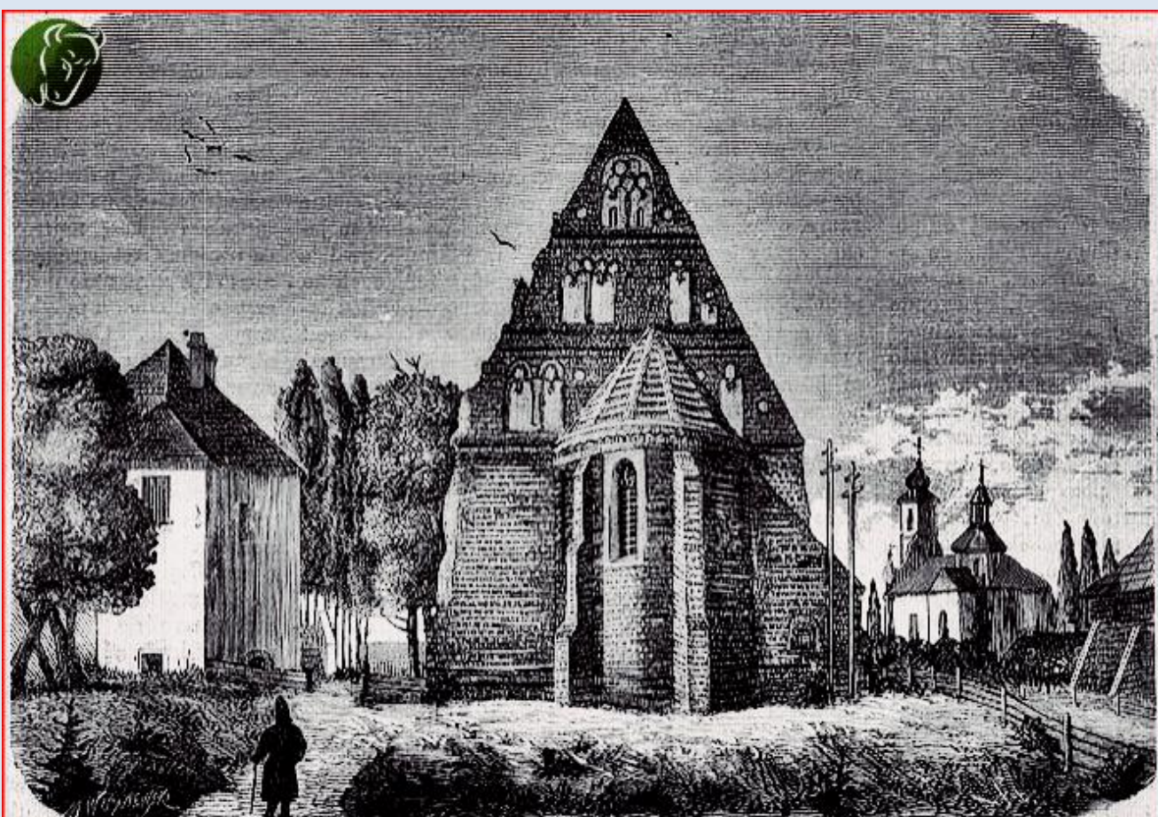
Zamek, Cerkiew i Kościół w Kodnia. (3370) (Podług rysunku J. Łoskiego.)