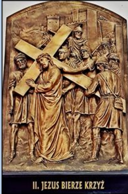
II. JEZUS BIERZE KRZYŻ