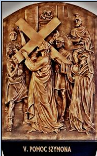
V. POMOC SZYMONA