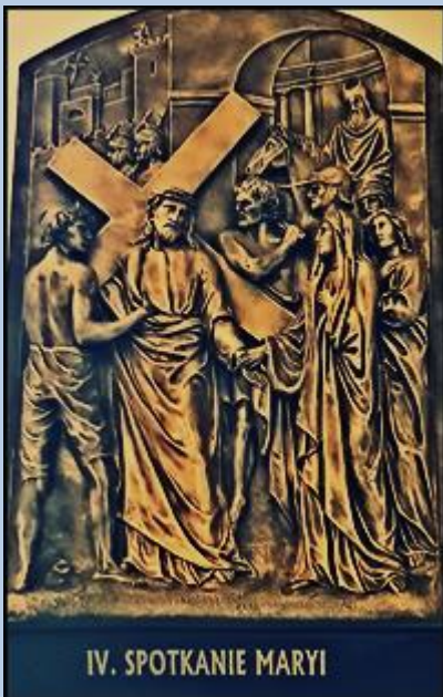
IV. SPOTKANIE MARYI