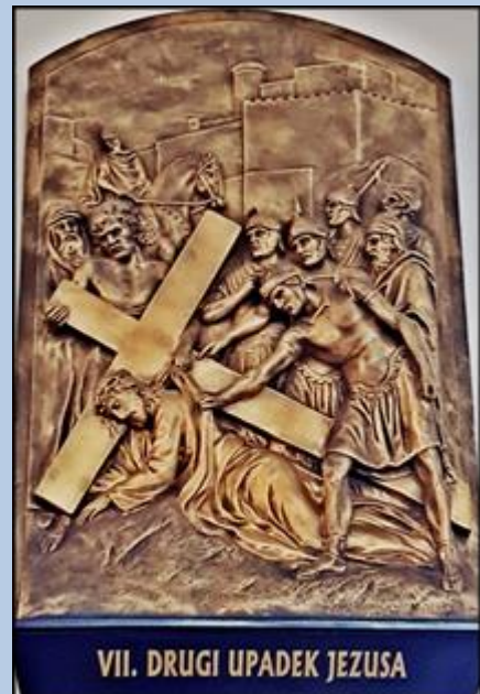
VII. DRUGI UPADEK JEZUSA