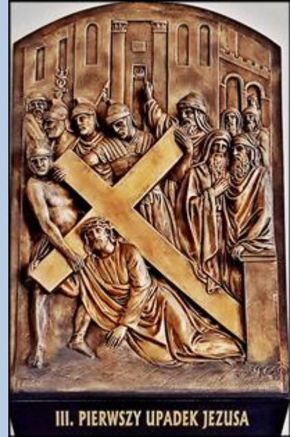
III. PIERWSZY UPADEK JEZUSA