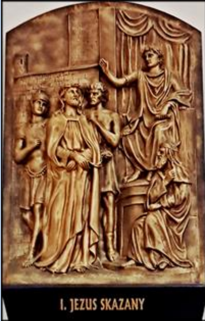
I. JEZUS SKAZANY