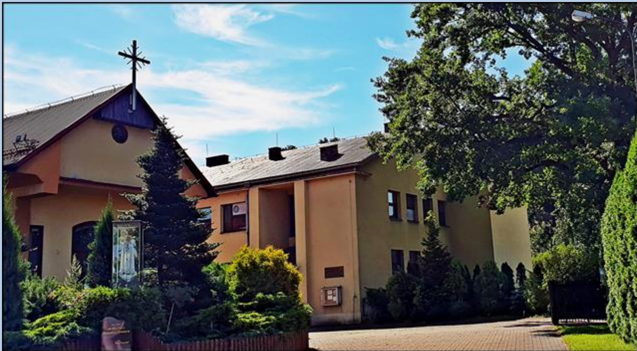
Kaplica przylegająca do kościoła