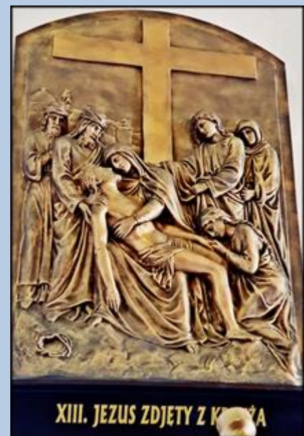
XIII. JEZUS ZDJETY Z KRZYŻA