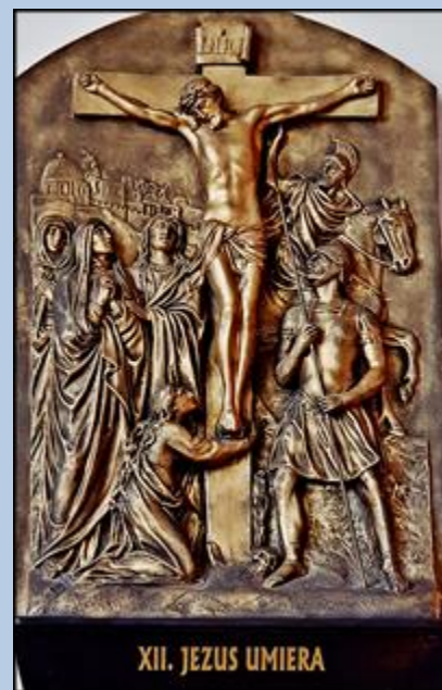
XII. JEZUS UMIERA