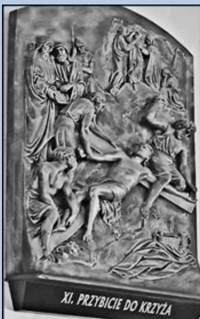
XI. PRZYBICIE DO KRZYŻA