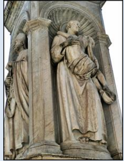
Saint Camille de Lellis