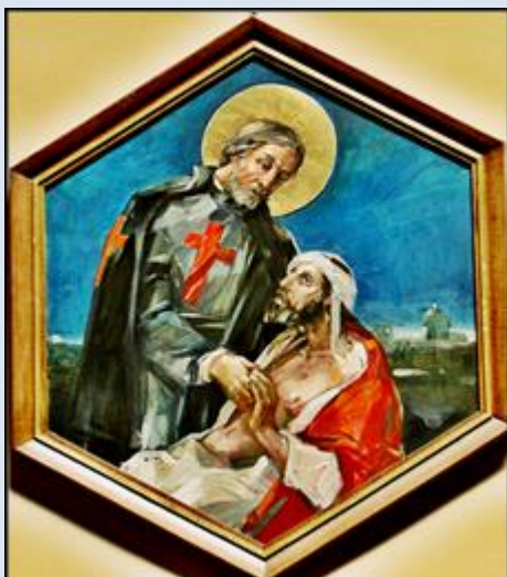
K15,9- Tarnowskie Góry, ob. w ko MB Uzdrawienia Chorych;

Jeżeli nie zaznaczono inaczej, to zdjęcia: Jan Nitecki