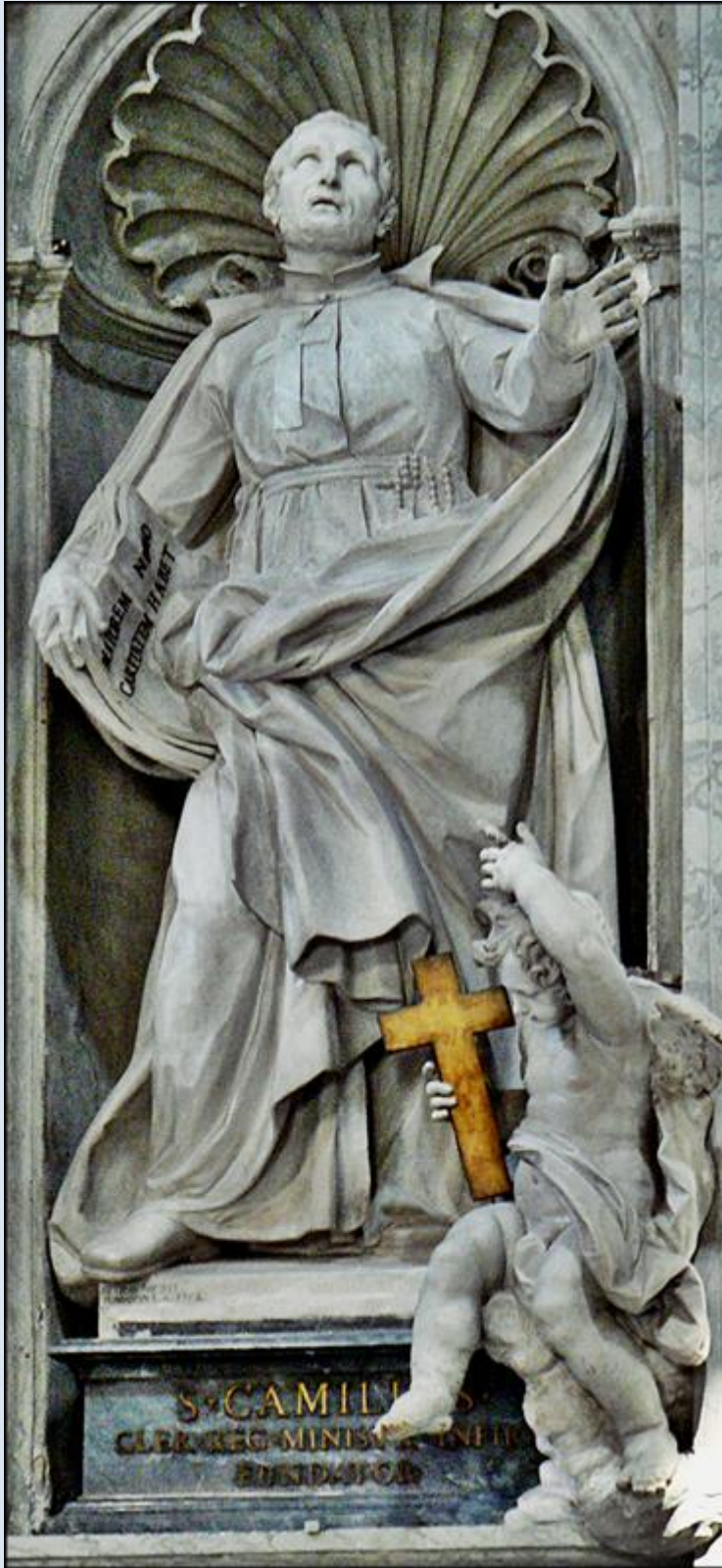
Rzym, figura w Bazylice św. Piotra

zobacz: Święci w Polsce i ich kult w świetle historii http://sancti-in-polonia.wietrzykowski.net/2k.html http://sancti-in-polonia.wietrzykowski.net/7k.html