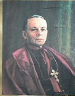
biskup Adolf Siedliski

Wojownik, pedagog, jeden z najwybitniejszych twórców oświaty w Polsce. W latach 1809-11 przeżył na Wołyniu trudne warunki życia, które wpłynęły na jego twórczość.