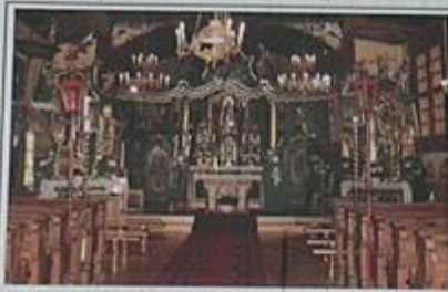
Prezbiterium z ołtarzami bocznyimi

Stowarzyszenie Rozwoju Spisza i Doliny www.spisz.info