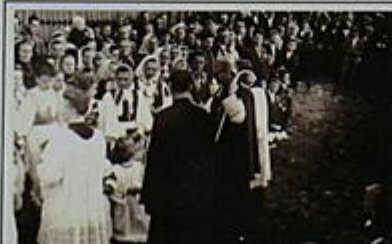
Udzielanie sakramentu bierzmowania przez bp Karola Wojtyłę w 1962r.