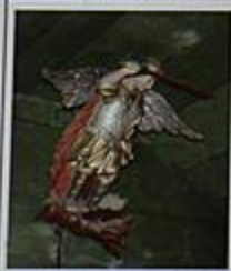
"Jurgowski diabeł" św. Michał Archanioł pokonuje szatana

Nieopodal kościoła jest stary cmentarz, gdzie można zobaczyć zabytkowe nagrobki z napisami jeszcze w języku węgierskim.