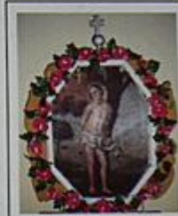
Patron Kościoła św. Sebastian na feretronie