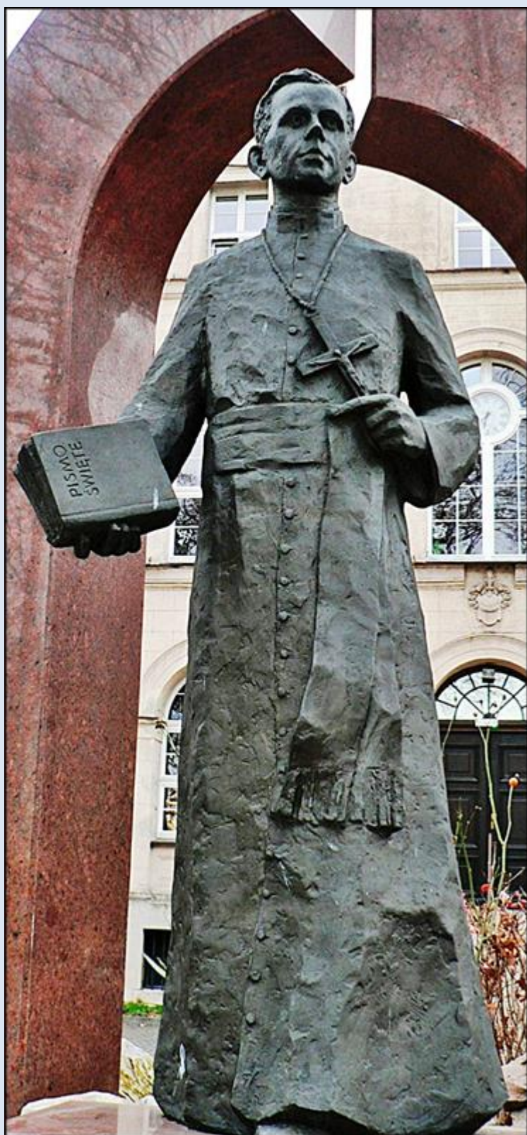
Lubliniec, figura koło Kościoła pw. św. Stanisława Kostki