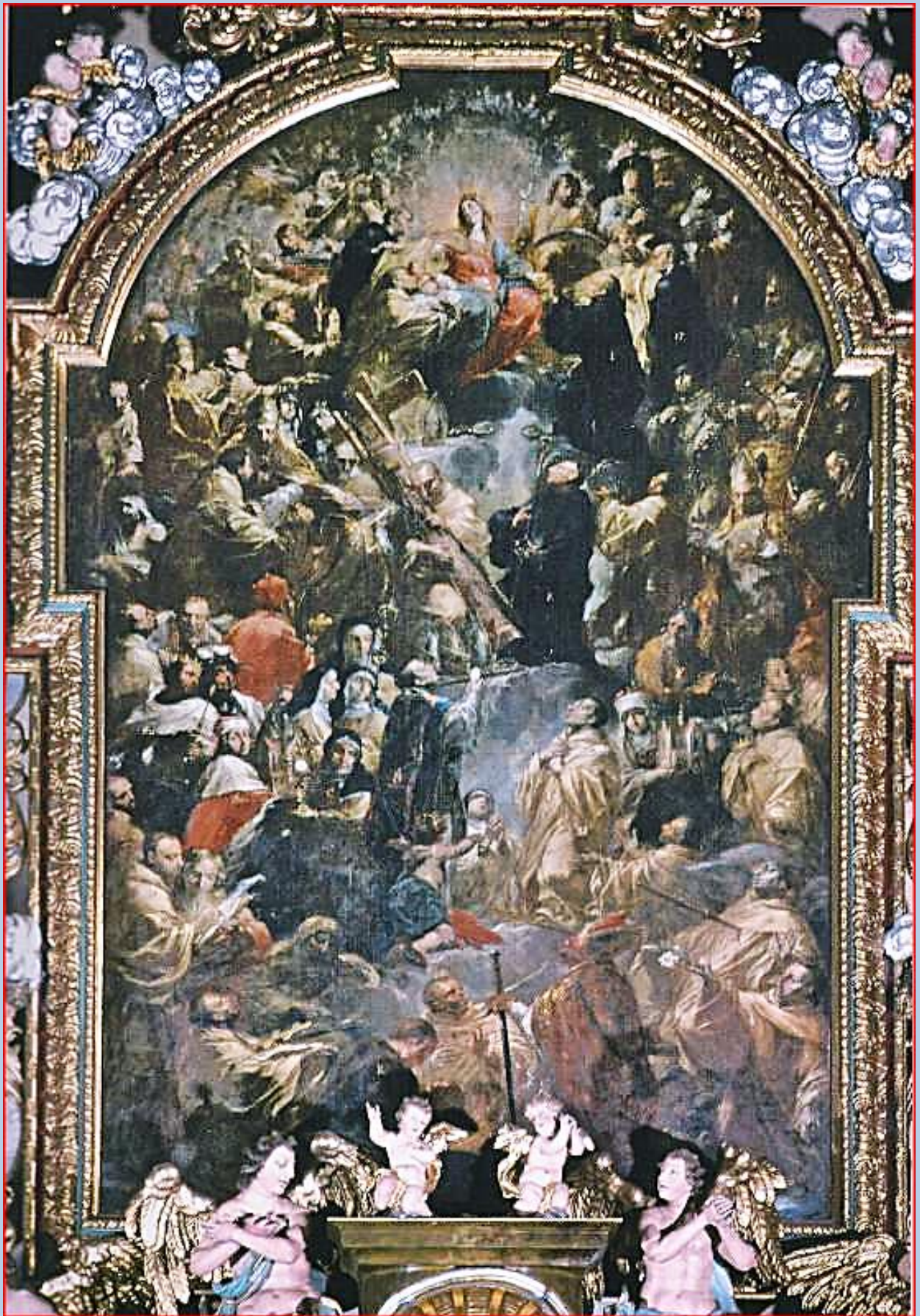
Maria jako Królowa Niebios w otoczeniu świętych cysterskich Obraz Michalea Willmanna