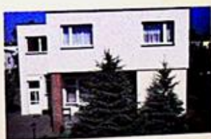
Dom Zgromadzenia w Toruniu

Założone przez św. Hieronima Emiliani we Włoszech, w niewielkiej miejscowości Somasca, w pobliżu Lecco. Zatwierdzone przez Kościół w 1568 r. Celem Zgromadzenia jest służba najuboższym i ubogim w pokorze serca, cichości, dobroduszości oraz umiłowaniu pracy i ubóstwa. Żyjąc we wspólnocie zakonnicy dążą do świętości poprzez modlitwę i służbę ubogim, a przede wszystkim dzieciom i młodzieży opuszczonej, potrzebującej pomocy materialnej i duchowej. Zgromadzenie obecne jest w 18 krajach na świecie. Ojcowie Somascy, dla dobra Kościoła i w odpowiedzi na wezwanie jego pasterzy, angażuje się w wychowanie ludzkie i chrześcijańskie młodzieży, poświęcając się działalności duszpasterskiej. W Polsce, obecne jest od 1995 roku. W Diecezji Toruńskiej, w Toruniu znajduje się pierwsza i jedyna placówka Zgromadzenia w Polsce. Wspólnota ma charakter domu formacyjnego, w którym kandydaci do Zgromadzenia studiując filozofię przygotowują się do rozpoczęcia nowicjatu. Przy wspólnocie funkcjonuje świetlica - oratorium oraz boisko dla dzieci i młodzieży. Ojcowie Somascy prowadzą dodatkowo placówkę wychowawczą – opiekuńczą „Insieme – Razem.”